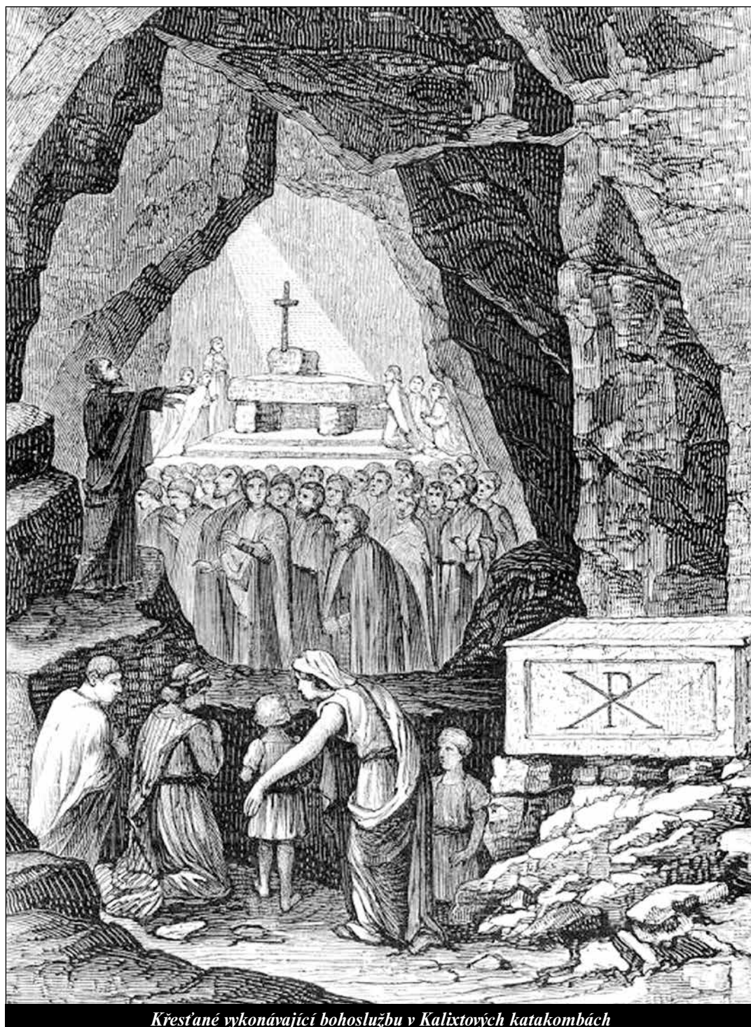
Křesťané vykonávající bohoslužbu v Kalixtových katakombách