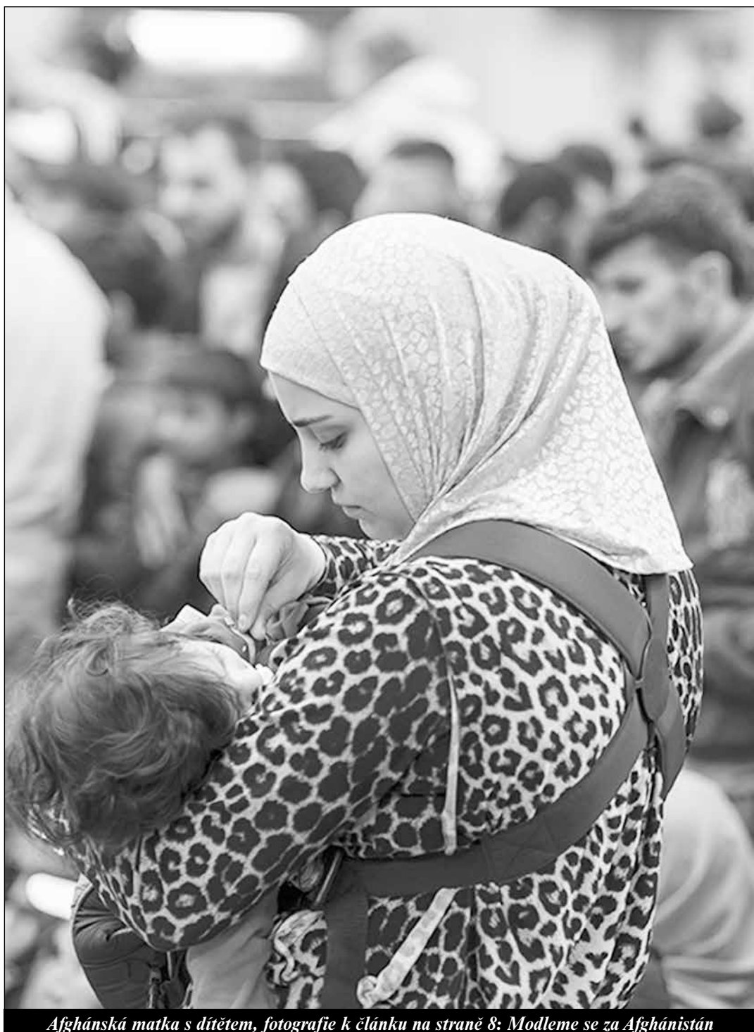
Afghánská matka s dítětem, fotografie k článku na straně 8: Modleme se za Afghánistán

Z dětí, které přežijí potrat, jsou ještě zaživa odebírány tkáně a žádané orgány - strana 12 -