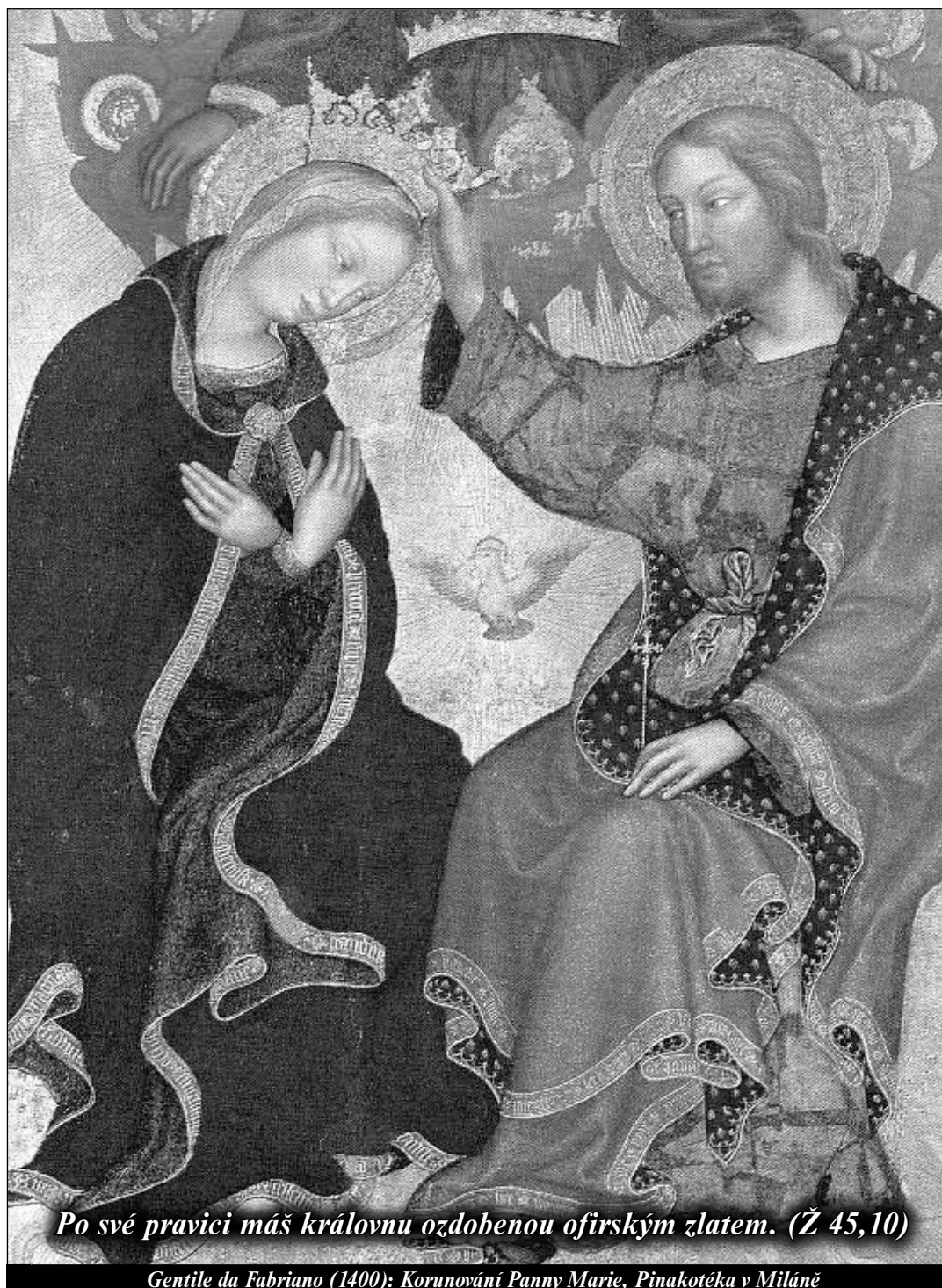
Po své pravici máš královnu ozdobenou ofirským zlatem. (Ž 45,10)

„Chléb, který já vám dám, je mé tělo“ P. Bernard Speringer ORC - strana 12 -