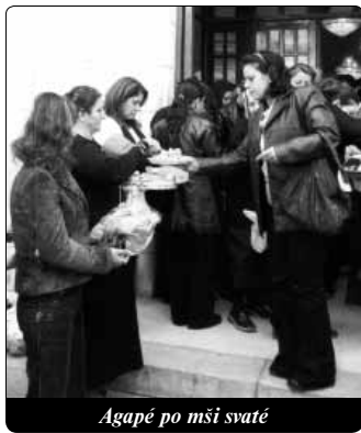
Agapé po mši svatě