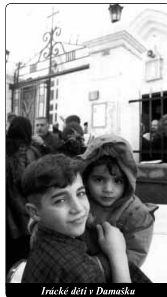
Irácké děti v Damašku

počítali s rychlým, enormním proudem utečenců - podobně jako po válkách v Africe. Všechny instituce byly ve stavu pohotovosti, byly připraveny fondy. Ale utečenců nebylo. S výjimkou malých skupin, lidí, kteří byli ve spojení s minulým režimem, báli se represálií a jimž se podařilo uložit jmění v zahraničí. V posledních dvou a půl letech, když už připravenost ochabla, začal se náhle potůček utečenců měnit na velký proud, který nás tak zaskočil, že jsme jako hostitelská země byli vystaveni velké zkoušce. Každý týden 30 - 40 tisíc uprchlíků do naší země, lidé nejrůznějších etnických a náboženských skupin, ze všech sociálních tříd, i ti, kteří žili v blahobytu, přicházejí a nemají vlastně nic. Odhaduje se, že mezitím přišel do Sýrie nejméně milion lidí. Podle vládních odhadů je jich ještě více. Biblický exodus, který se neodehrává v utečeneckých táborech, ale v předměstských slumech a chaotických zónách Damašku, ze strachu před strategickými bombami, před světem, který