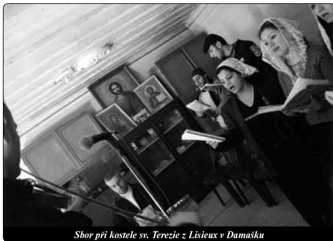
Sbor při kostele sv. Terezie z Lisieux v Damašku