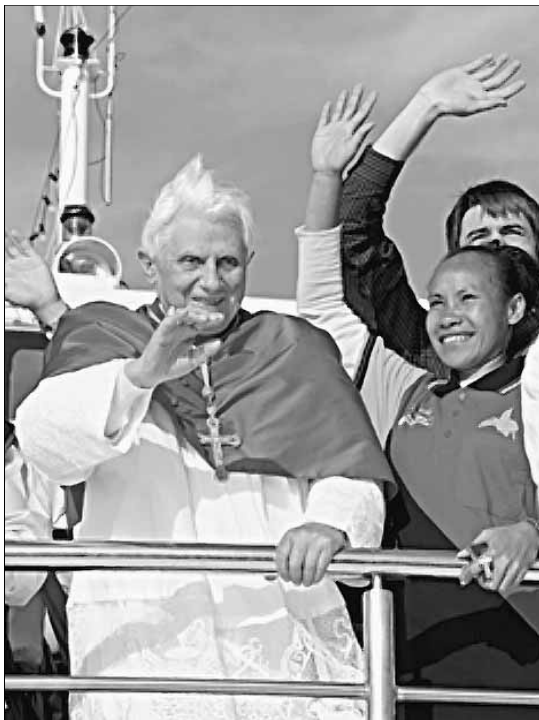
Papež Benedikt XVI. na 23. Světových dnech mládeže v Sydney