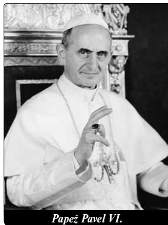
Papež Pavel VI.

Přítom je jasné, že tato neposlušnost se nemohla omezit pouze na otázku antikoncepce. Kdo ve jménu svého vlastního míně-