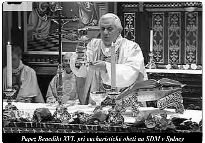
Papež Benedikt XVI. při eucharistické oběti na SDM v Sydney

Jak vzácné je duchovní svaté přijímání, řekl sám Ježíš v jednom vidění svaté Kateřině Sienské. Světice se obávala, že duchovní přijímání ve srovnání se svátostným nemá žádnou zvláštní cenu. Ježíš se jí zjevil, držel v ruce dva kalichy a řekl: „Do tohoto zlatého ukládám tvoje svátostná přijímání. Do tohoto stříbrného tvoje duchovní přijímání. Oba tyto kalichy jsou mi velice drahé.“ ▶