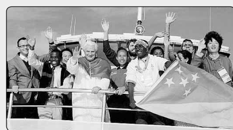
Promluvy Svatého otce na 23. Světových dnech mládeže v Sydney budeme našim čtenářům postupně přinášet v dalších číslech Světa.

Když Ježíš uslyšel o smrti Jana Křtitele, odebral se lodí na opuštěné místo, aby byl sám. Jakmile o tom lidé uslyšeli, šli pěšky z města za ním. Když vystoupil a uviděl velký zástup, bylo mu jich líto a uzdravil jejich nemocné. K večeru k němu přistoupili učedníci a řekli: „Toto místo je opuštěné a už se připozdilo. Rozpusť proto zástupy, ať se rozejdou po vesnicích a koupí si něco k jídlu.“ Ale Ježíš jim řekl: „Není třeba, aby odcházeli. Vy jim dejte jíst!“ Odpověděli mu: „Máme tady jenom pět chlebů a dvě ryby.“ Ježíš řekl: „Přineste mi je sem.“ A rozkázal, aby se lidé posadili na trávě. Potom vzal těch pět chlebů a ty dvě ryby, vzlhl k nebi a požehnal, lámal chleby a dal učedníkům a učedníci zástupům. Všichni se najedli dosyta a ještě sesbírali plných dvanáct košů zbylých kousků. Těch, kdo jedli, bylo na pět tisíc mužů kromě žen a dětí.