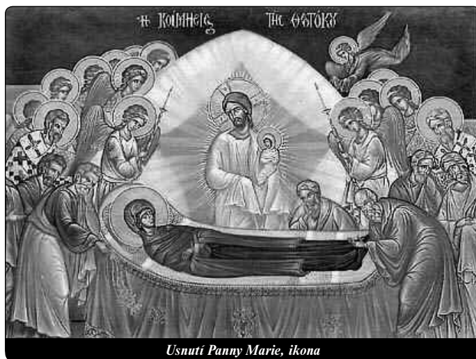
Usnutí Panny Marie, ikona

Nebyla také Maria skrytou postavou zvratu? Nikoliv pouze jednou z mnoha, nýbrž skutečnou postavou zvratu! Dnes je možno ve světě pozorovat podivuhodné probuzení pro tajemství Matky Boží. Jako nová „Jitřenka spásy“ vystupuje Maria nad temné hory, do kterých byla dlouho zatlačena. Dnes se šíří mezi tvorstvem hluboký pocit, že Žena, která Bohu darovala život a s ním se chtěl provždy spojit v obdivuhodné jednotě, přejímá podíl na dimenzích věčnosti a dějinách spásy.