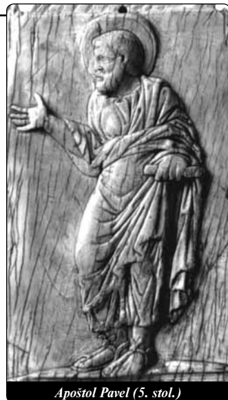
Apoštol Pavel (5. stol.)

4. Poslední doporučení (v. 32-35): A nyní vás odporoučím Bohu a slovu jeho milosti, které má moc vzdělávat a zjednat dědictví ve společenství všech posvěcených. Stříbro ani zlato, ani šaty jsem od nikoho nežádal. Víte sami, že tyto moje ruce vydělaly na všechno, co jsem potřeboval já a moji společníci. Ve všem jsem vám dal dobrý příklad, jak se vlastní prací máte ujmát potřebných, a pamatoval jsem tím na slova Pána Ježíše, který řekl: „Blaženější je dávat než dostávat.“ Je to krásná podoba Pavla, který mohl ukázat své ruce a říct: těmto rukama jsem vydělal na všechno potřebné pro sebe a pro své společníky. Těžko si můžeme představit, jak si mohl vydělávat vlastníma rukama na svou obživu, a přitom ve dne v noci kázat. Proto dovednost vydělat na sebe a nezatěžovat druhé je velmi důležitá, zvláště, když se jedná o to, pomáhat těm, kteří jsou v nouzi.