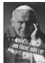
Studio Telepace, 55 minut, 250 Kč

Trojí ohlédnutí za velkým papežem Janem Pavlem II., za jeho láskou k Bohu, k člověku dnešního světa a zejména k mladým lidem všech kontinentů.