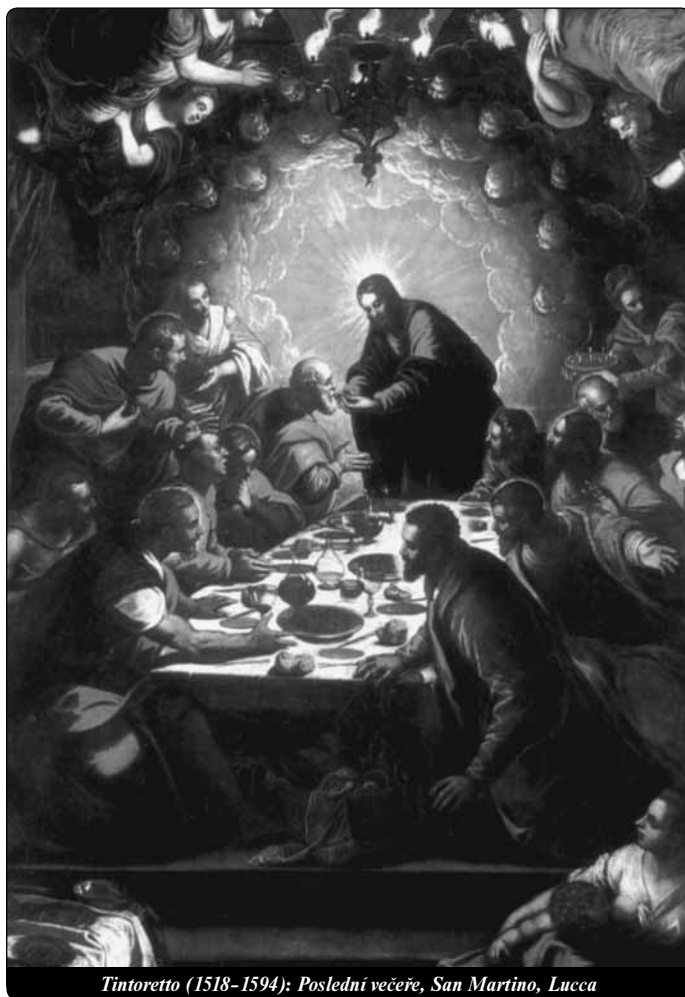
Tintoretto (1518–1594): Poslední večeře, San Martino, Lucca

Když Ježíš říká učedníkům o velikonočním večeru „Pokoj vám“ (Jan 20,19), pak jim daruje tento šalom, tento pokoj. O velikonoční neděli daruje učedníkům celou spásu, kterou vydobyl na kříži. Tím však Ježíš nedaruje něco, nýbrž daruje sám sebe. On sám je Šalom, on sám je Pokoj.