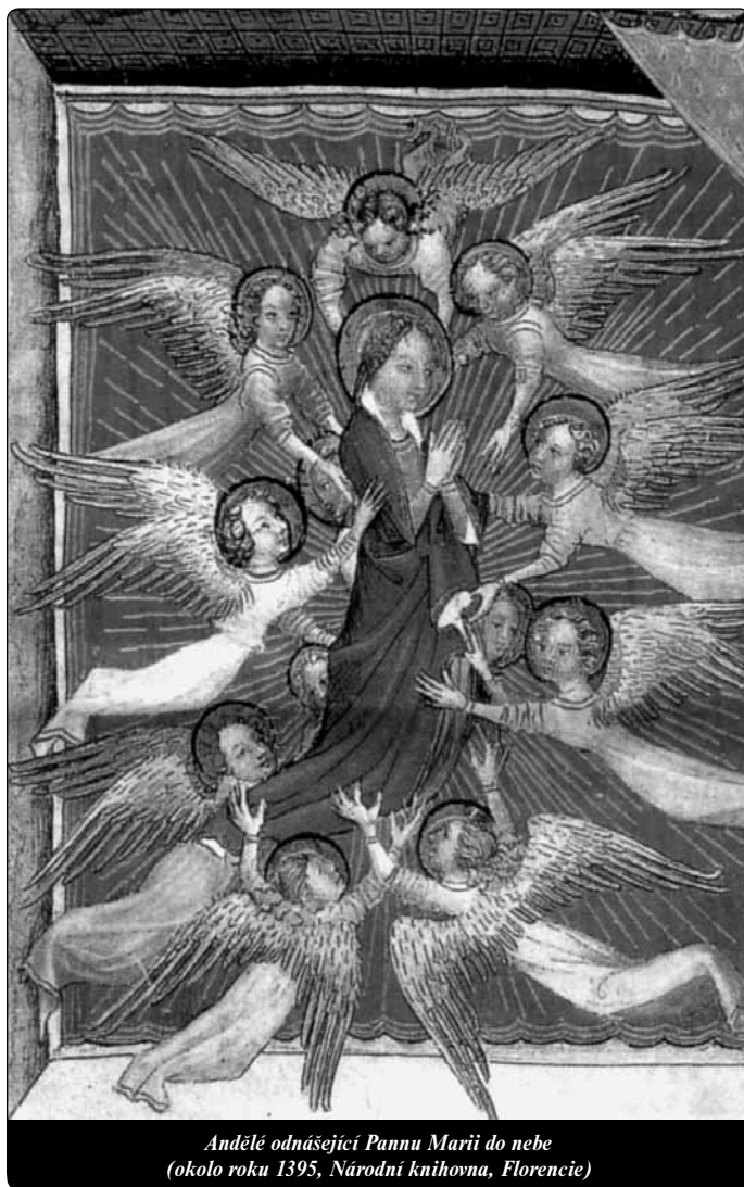
Andělé odnášející Pannu Marii do nebe (okolo roku 1395, Národní knihovna, Florencie)

mezi Marií a apoštolátem ještě těsněji, když o Marii prohlásil, že „apoštolům štědrě předala onen poklad Božích slov, která uchovávala ve svém srdci“ (5) . Ona v sobě tedy uchovávala poklad Božího slova a v plnosti ho všem předávala. Na to poukázal Pius XI. († 1939) ve své misijní encyklice „Rerum Ecclesiae“, když napsal, že „na Kalvárii byli Marii svěření všichni lidé“ (6)