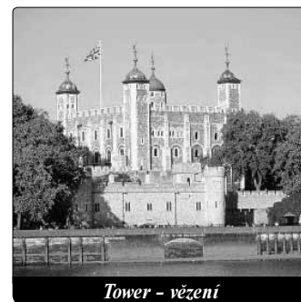
Tower - vězení

Biskup z Rochestru byl vlastně jediným prelátem, který ve dnech zkoušky stanul nekompromisně na straně pravdy a za