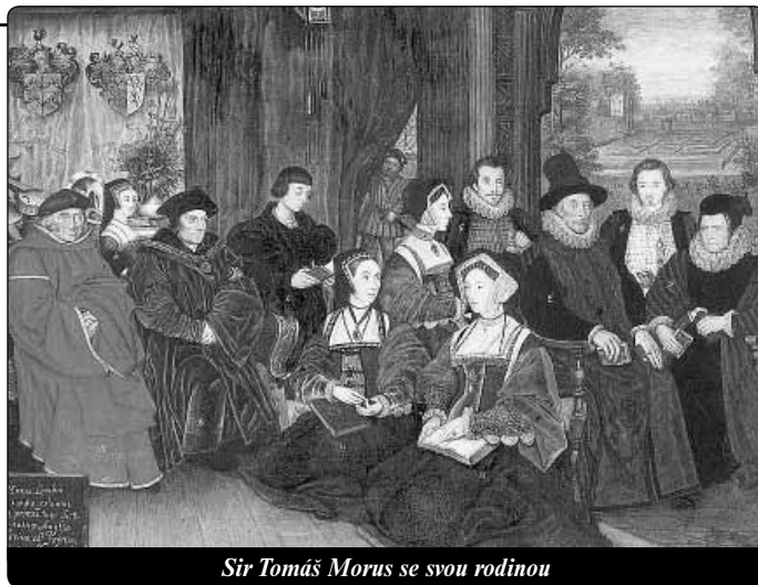
Sir Tomáš Morus se svou rodinou

1. července byl k trestu smrti odsouzen Tomáš Morus. Podobně jako mučedník – kardinál i Tomáš během svého procesu odvážně vyjadřoval své přesvědčení, že aktem zrady je