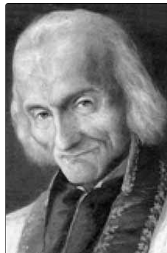
Sv. Jan Maria Vianney

Během obřadů nechce spát, to je pravda, má strach, aby ji přitom někdo neviděl, ale ani trochu se nepřemáhá. V průběhu modlitby nebo mše svaté nechce být roztržitá. Ale místo aby