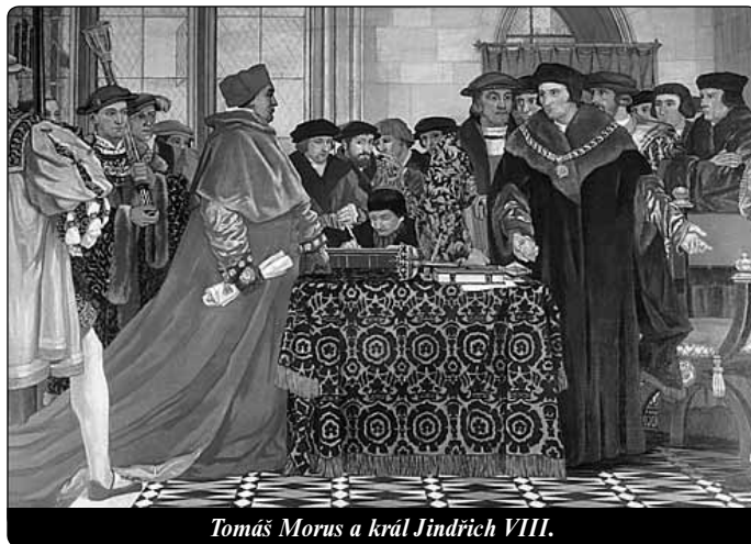
Tomáš Morus a král Jindřich VIII.

Po vynesení rozsudku ve svém posledním vystoupení vyjádřil odsouzený přesvědčení, že supremace nemůže v Církvi záviset na světském člověku, ale „náleží pravomocně Římskému stolci, protože moc předal Pán osobně svatému Petro-