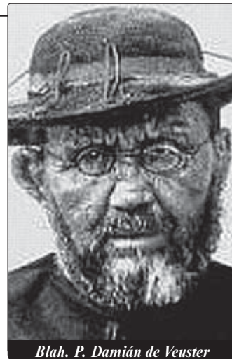
Blah. P. Damián de Veuster

Josef projevil ve studiu latiny takovou pílí, že ho nakonec představení připustili ke klášternímu studiu. Během tohoto studia propukla epidemie tyfu a jeho bra-