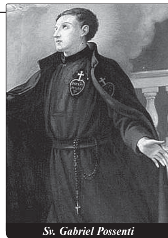
Sv. Gabriel Possenti