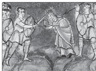
Mučednická smrt sv. Bonifáce

odložena má smrtelná schránka, vystoupím si pro věčnou odměnu. Ale ty, nejdražší synu, svolávej bez pózy lid od hnízda bludu, dokonči započatou baziliku ve Fuldě, tam dopravíš moje tělo, zestárlé po dlouhých letech života“ (Willibald, Vita S. Bonifatii , s. 46). Právě když 5. června 754 začínal mši svatou v Dokkumu (dnešní severní Holandsko), byl přepaden hordou pohanů. Postavil se proti nim s klidným čelem a zakázal svým lidem bojovat slovy: „Přestaňte, synáčkové, s bojem, zanechte války, protože svědectví Písma nás napomíná, abychom neopláceli zlým za zlé, ale dobrým za zlé. Hle, přišel můj vytoužený čas, hle, načešla doba našeho konce, odvalu v Pánu!“ (tamt. s. 9–50). Byla to jeho poslední slova, než klesl pod ranami útočníků. Ostat-