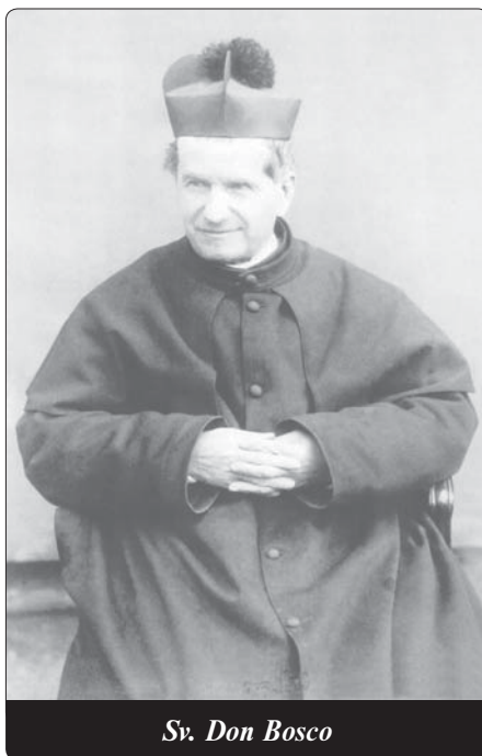
Sv. Don Bosco

V každém případě měly být z trestů vyloučeny všechny tresty tělesné. Vychovatel nikdy nesmí s provinilcem jednat v afektu: „Jakékoli bití, klečení v bolestné poloze, tahání za uši a jiné podobné tresty