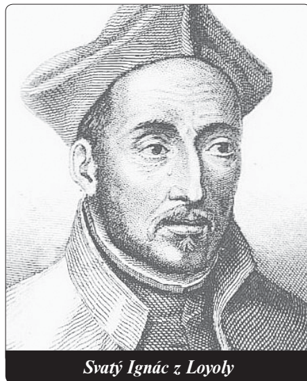
Svatý Ignác z Loyoly

Ignác teď srovnal působení obou myšlenkových pochodů, které v něm vznikly. Přitom zjistil: „Když se zabýval světskými myšlenkami, měl v nich velké zalíbení. Když se ale potom unavil, upustil od toho, připadal si jako vyprahlý a rozmrzelý. Když ale pomyslel na to, aby šel bosý