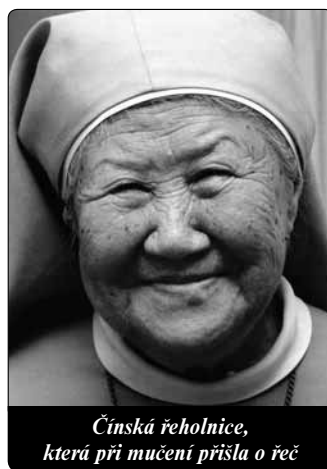
Čínská řeholnice, která při mučení přišla o řeč

ná instituce. Nebo že bude vždy existovat v našich zemích. Ježíš zaručil jen existenci Církve jako celku pod vedením Petra a jeho nástupců (Mt 16,18). Ve kterých zemích bude Církev existovat a kolik bude mít věřících, s tím si nemusíme lámat hlavu