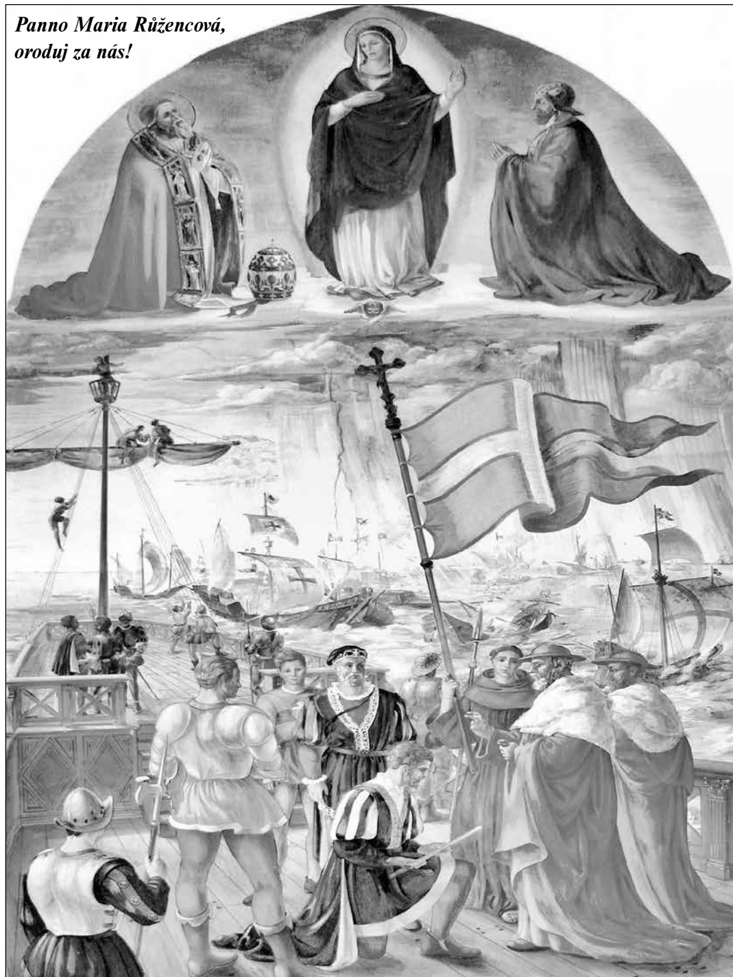
Bitva u Lepanta 7. října 1571 v Jónském moři v Korintském zálivu u přístavu Nafpaktos (Lepanto)