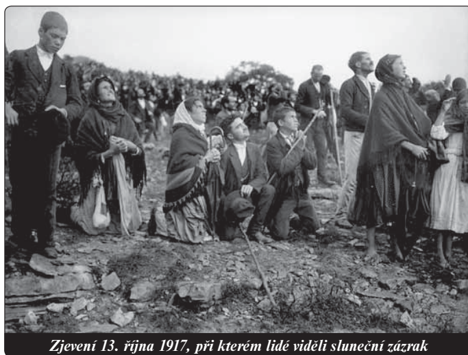
Zjevení 13. října 1917, při kterém lidé viděli sluneční zážrak

Jedna z nejostřejších kontroverzí vzplanula kolem identifikace bílé oděného biskupa s Karolem Wojtylou. Jinými slovy: předpověděla Matka Boží skutečně atentát na Karola Wojtylu? Socci ve své knize upozorňuje na to, že vatikánská interpretace tajemství není tak zcela jednoznačná. A to již od oznámení kardinála Sodana, jehož slova jsou opět v dokumentu k fatimskému tajemství: tam kardinál prohlašuje, že „v tajemství popisované události, jak se zdá, patří minulosti“.