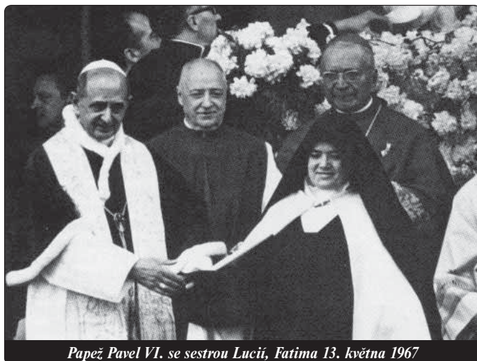
Papež Pavel VI. se sestrou Lucií, Fatima 13. května 1967

Ke zveřejnění prvních dvou tajemství, ve kterých se předpovídá ruská revoluce a druhá světová válka, došlo ve 40. letech. Třetí tajemství mělo být podle přání sestry Lucie oznámeno až v roce 1960. V roce 1957 však Svatý stolec nařídil, aby text poslala do Říma, a sestře uložil mlčení. Toto mlčení bylo přerušeno až v roce 2000 zveřejněním dokumentu Poselství Fatimy Kongregací pro nauku víry.