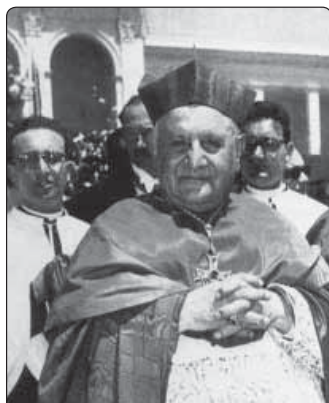
Angelo Giuseppe Roncalli (budoucí papež Jan XXIII.) ve Fatimě 13. května 1956