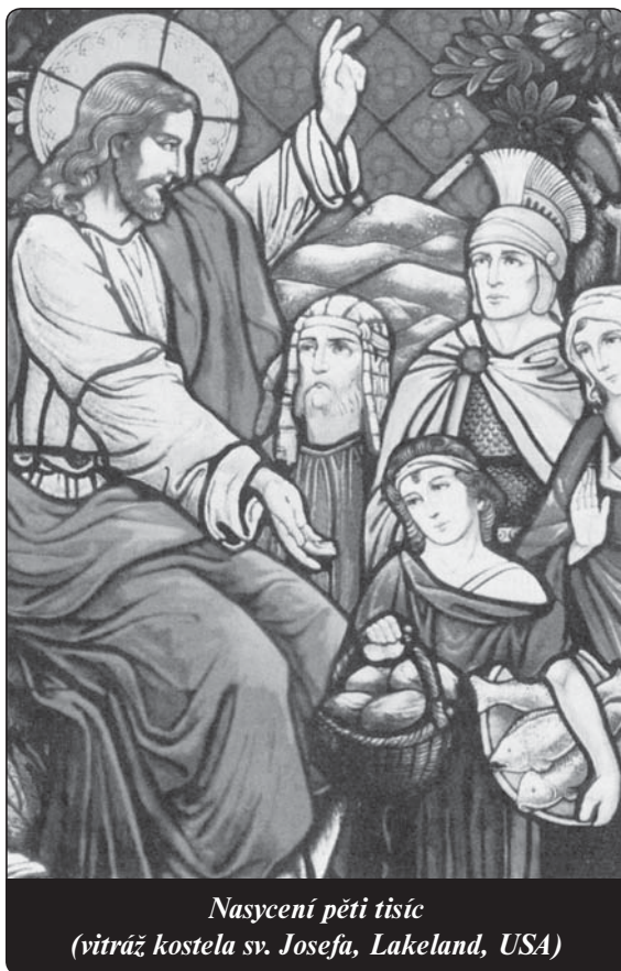
Nasyčení pěti tisíc (vitráž kostela sv. Josefa, Lakeland, USA)

Množství lidí, kteří spásu Pána odmítají, odmítají jeho milost a neúprosně se vydávají do otroctví satanova tím, že následují modly, naslouchají učení a jiným filosofiím, které přinášejí jenom pochybnosti, zoufalství, nevyčísitelné utopie, nenávisť... Co všude vidíme: Lidé upadají politováníhodným způsobem do rukou nečistých duchů, kteří hanebnými hovory, špatnými obrazy naplňují srdce hořkostí, hryzáním svědomí, tmou, zlem, strachem a zoufalstvím. Mnoho lidí naší doby, kteří se vzdá-