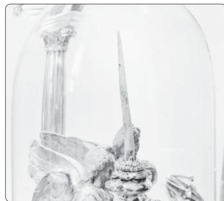
Zvláště pro osoby překonávající bolest je vykvétající Svatý trn symbolem naděje