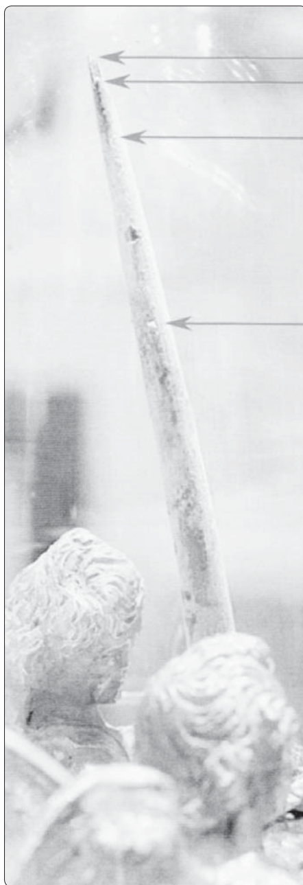
Svatý trn s označenými místy vykvétání, Velký pátek roku 2016

Význam Svatého trnu z Andrie nespočívá ani v jeho fyzické velikosti (počítané na několik centimetrů a srovnávané s délkou prsteníku), ani v jedinečnosti – podobných trnů se dá na světě napočítat velmi mnoho, a navíc jeho autentičnost nebyla nikdy potvrzena. A přece Bůh vybral právě to málo známé místo na jihu