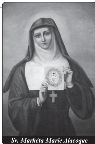
Sv. Markéta Marie Alacoque

Paměti z té doby zaznamenaly, že drahá novicmistrová přišla jako první vzdát úctu Božskému Srdci; pak následovaly novicky, každá s vlastním aktem zasvěce-