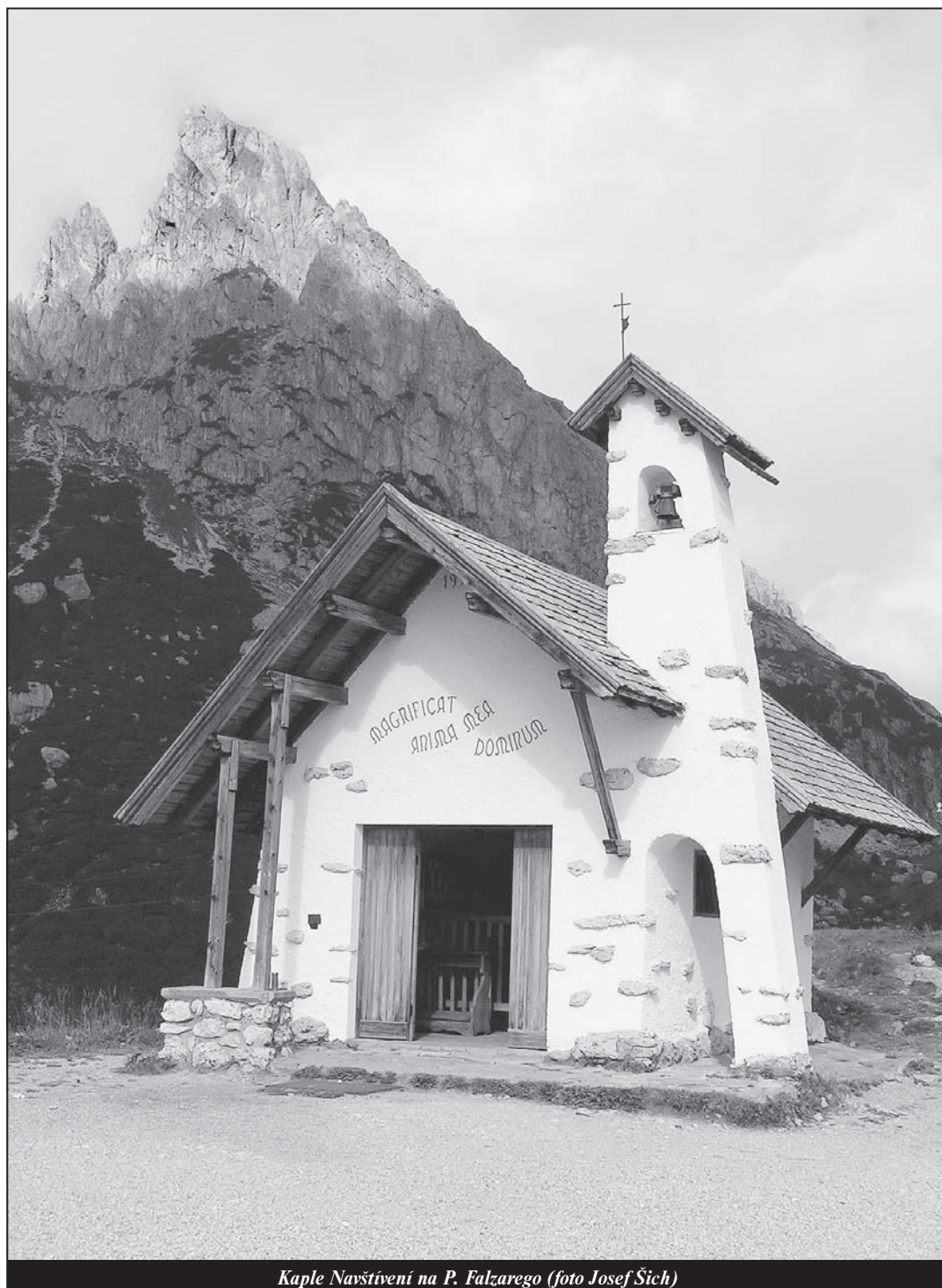
Kaple Navštívení na P. Falzarego