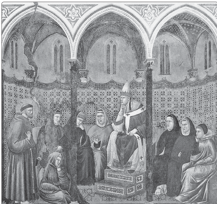
František před Honoriem III., nástupcem Inocence III. (freska Giotto di Bondone v horním kostele San Francesco, Assisi)

František měl tedy nejvyšší úctu ke kněžím. Dokonce na nich nechtěl vidět hříchy – protože jejich životní proměna neodpovídá tomu, čím skrze své svěcení jsou: jednajícimi ve jménu Kristově. Je-