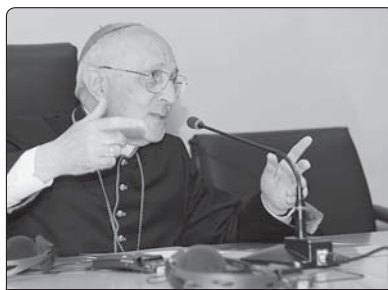
Mons. Protase Rugambwa, prezident PMD a pomocný sekretář Kongregace pro evangelizaci národů

V e dnech 13. – 17. května 2013 proběhlo v Římě každoroční Generální shromáždění Papežských misijních děl (PMD). Zúčastnili se ho národní ředitelé PMD přibližně ze 150 zemí všech kontinentů. Prefekt Kongregace pro evangelizaci národů, kardinál Fernando Filoni, ve své úvodní řeči zmínil, že mnozí ředitelé pracují v dramatických situacích, které způsobuje pronásledování, chudoba, násilí, konflikty atd., což ovlivňuje účinnost působení PMD. Proto navrhl některé obecné zásady, jako např. servisní struktury misí v každé zemi, které mají být realizovány, a připomněl identitu a ducha PMD.