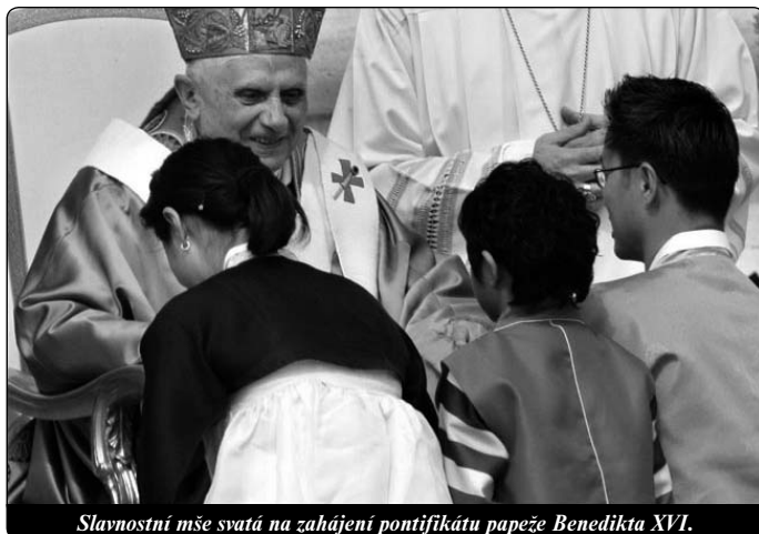
Slavnostní mše svatá na zahájení pontifikátu papeže Benedikta XVI.

čí. Církev jako celek a pastýři v ní se musí jako Kristus vydat na cestu, aby vyvedli lidi z pouště na místo života, k přátelství s Božím Synem, k tomu, který dává život, a to život v hojnosti. Symbol beránka má ještě další aspekt. Ve starověkém Orientu bylo zvykem, že králové označovali sebe za pastýře svého lidu. Byl to obraz jejich moci, obraz cynický: národy byly pro ně jako ovce, s nimiž mohl pastýř nakládat podle libosti. Naopak Pastýř všech lidí, živý Bůh, se sám stal beránkem, postavil se na stranu beránků, těch, kteří jsou pošlapáváni a zabíjeni. Právě tak se on zjevuje jako pravý pastýř: „Já jsem dobrý pastýř... Dávám svůj život za ovce,“ říká Ježíš sám o sobě (Jan 10,14n). Není to moc, co přináší vykopení, nýbrž láska! Toto je Boží znamení: on sám je láska. Kolikrát jen bychom chtěli, aby se Bůh ukázal mocnější, aby tvrdě zasáhl, aby potřel zlo a vy-