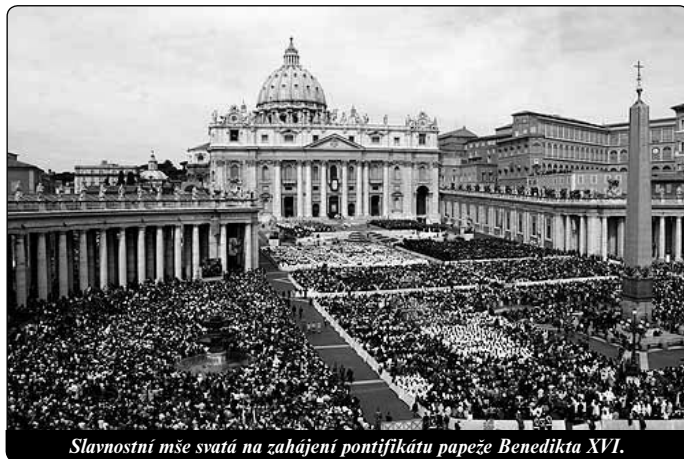
Slavnostní mše svatá na zahájení pontifikátu papeže Benedikta XVI.

naše radost: Boží vůle nás neomezuje, ona nás očisťuje – někdy také bolestně – a tak nás přivádí k nám samým. Tak nesloužíme pouze jemu, nýbrž spásáme celé světo, celých dějin. Symbolika pallia je ve skutečnosti ještě konkrétnější: ovčí vlna má představovat ovci ztracenou nebo také nemocnou či zesláblou, kterou pastýř bere na svá ramena a nese ji k vodám života. Podobnost ztracené ovci, kterou pastýř hledá na poušti, bylo pro církevní Otce obrazem tajemství Krista a Církve. Lidstvo – my všichni – jsme ztracená ovce, která nenachází na poušti cestu. Boží Syn to nestrpí; nemůže opustit lidstvo v tak politováníhodné situaci. Povstane, opustí nebeskou slávu, aby znovu našel ovečku a pachtí se