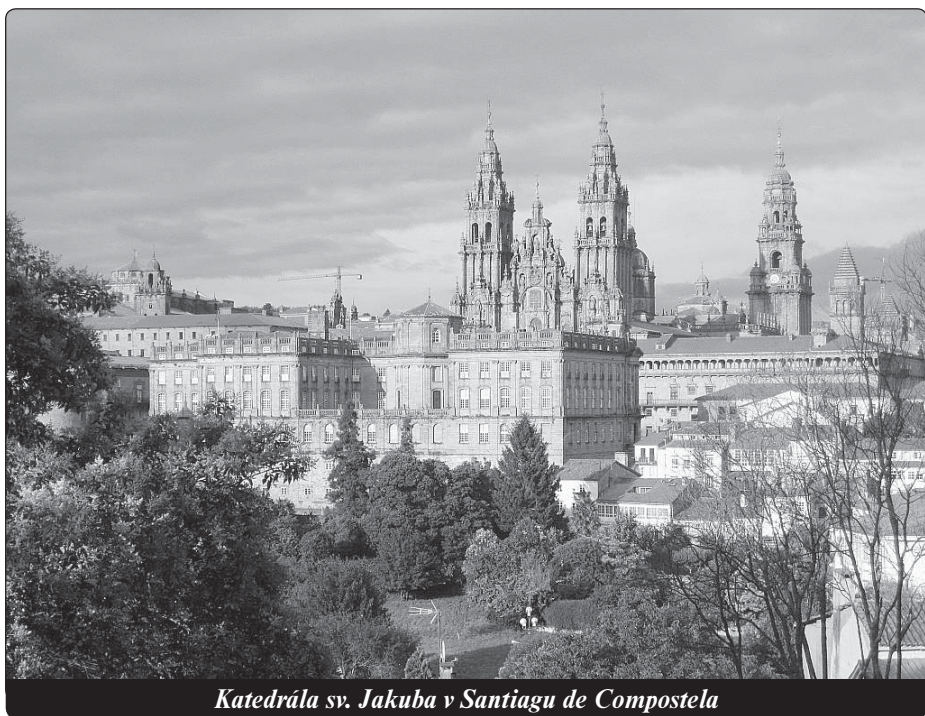
Katedrála sv. Jakuba v Santiagu de Compostela

Elstner dokázal podat zprávu i o méně rajsky půvabných zkušenostech. Jako jakubský poutník narazil také na provozovatelky nejstaršího řemesla na světě na