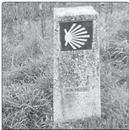
Ukazatel cesty do Compostely

Také arcibiskup ze Santiaga věděl o písni o bezbožném chování, i když se smířlivým závěrem: Před několika měsíci dostal nazpět z ruky španělského ministerského předsedy Rajoye rok předtím ukradený Codex Calixtinus . Jeden úředník odcizil tzv. „Jakubskou knihu“, sbírku středověkých rukopisů z dómského