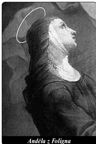
Anděla z Foligna

Čím více tedy poznáváme vřelého Boha, tím větší, dokonalejší a čistší je naše láska k němu a tím více nás láska k němu přetváří v něho.