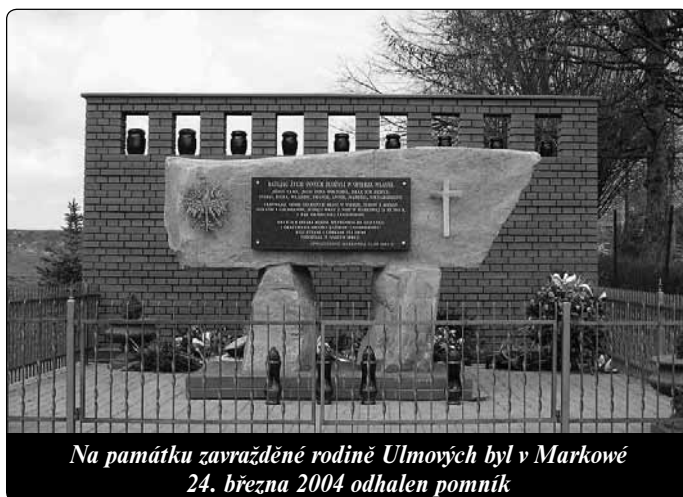
Na památku zavražděné rodiny Ulmových byl v Markowé 24. března 2004 odhalen pomník

Oddílů velmi záleželo na tom, aby zločin vidělo co nejvíce lidí. Jeden důstojník řekl formanům: „Podívejte se, jak hynou polské svině, které přechovávají Židy.“ Když po nějaké chvíli přišel starosta a ptal se velitele, proč zastřelili i děti, dostal odpověď: „Aby s nimi obec neměla starosti.“