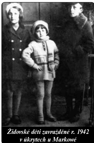
Židovské děti zavražděné r. 1942 v úkrytech u Markowé

Svědectví rodiny Ulmových je stále živé a promlouvá i k nám. Svoji oběti udělují odpuštění i tomu jidaši, který je vydal na smrt, i těm, kteří prokázali tolik krutosti a cynismu, a především nás