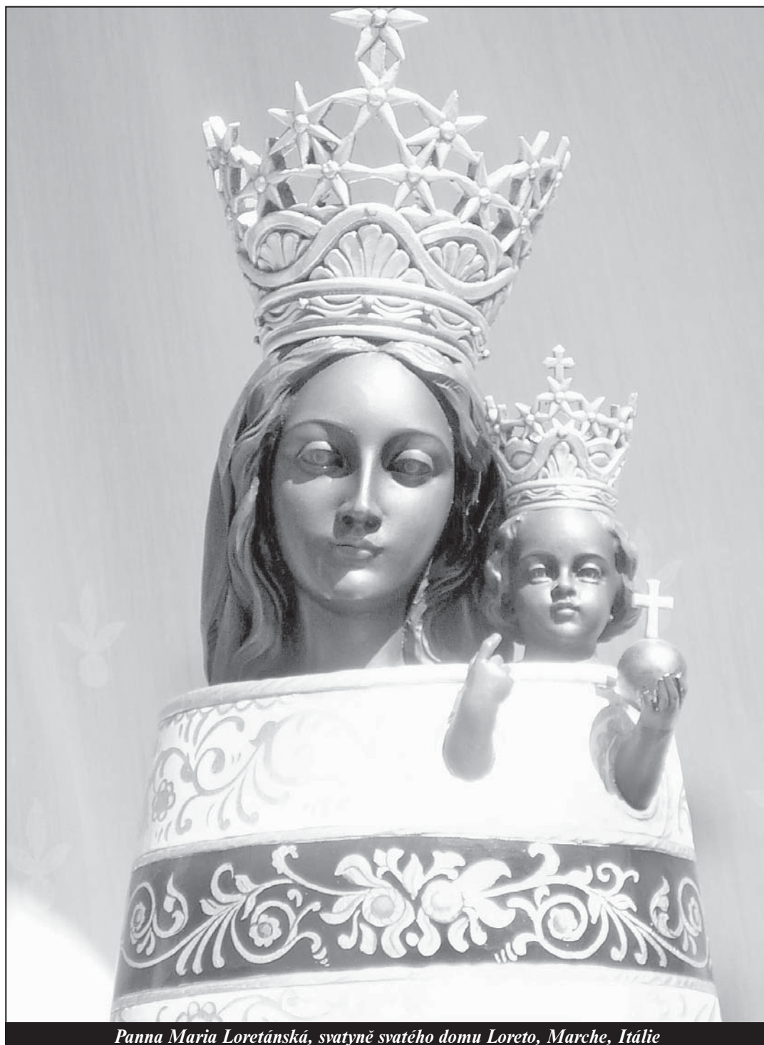
Panna Maria Loretánská, svatyně svatého domu Loreto, Marche, Itálie