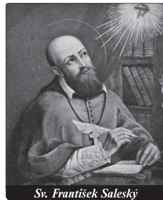
Sv. František Saleský