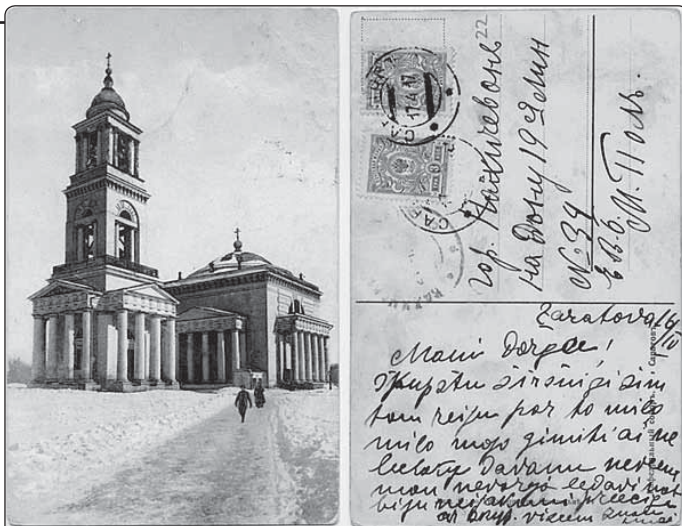
Pohlednice saratovské katedrály svatého Klimenta

Rok 2002 byl skutečně obtížným obdobím. Když si vzpomenu, jak jsem jako katolický student v cestovním zavazadle pašoval do SSSR Bible a předával je prosícím lidem v pravoslavných chrámech, pak mě opravdu bolelo, když se na mě o dvacet let později dívali jako na „nepřítele“. Byla zde nedorozumění, nevědomosti a nedostatek dialogu. Nesmíme také zapomenout, že pronásledování zanechalo stopy a rány ve všech církvích.