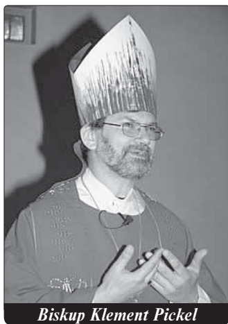
Biskup Klement Pickel

Jako všude v Rusku hraje krajina velkou roli při formování lidí. U nás jsou to Volha, široké stepi, severní Kavkaz a černo-mořské pobřeží. Moje biskupství sousedí s Ukrajinou, Kazachstánem, Ázerbájdžánem a Gruzii. Významná část obyvatel má islámské kořeny a republika Kalmykie má buddhistický ráz. Takové zvláštnosti jsou charakteristické pro určité oblasti, nikoliv pro celé biskupství.