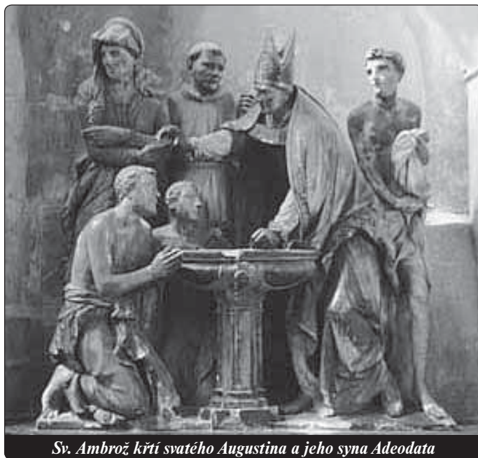
Sv. Ambrož křtí svatého Augustina a jeho syna Adeodata

Bollettino Vaticano 9. 1. 2008 Mezititulky redakce Světla