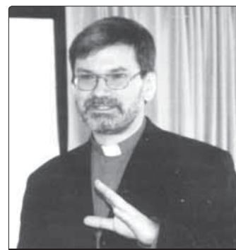
Biskup Klement Pickel

Bohužel ano. Protože se přitom jedná o lidi, ve kterých vidím především „sourozence“ a věřící, snažím se pomáhat si, jak se dá. Kdybych teď mluvil o jednotlivých špatných zkušenostech, ničemu by to nepomohlo. Napětí většinou zmizí, když se představím jako katolický duchovní. Skutečně negativní a agresivní reakce jsem zažil během 16 let nejvíce čtyřikrát pětikrát.