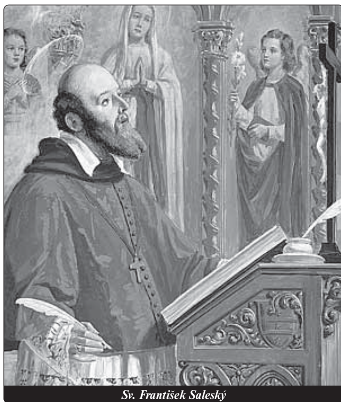
Sv. František Saleský

Po sedmi letech začala fronta protivníků ustupovat a nastaly konverze. Kdo ho poznal zblízka, mohl se přesvědčit, že je to pravý kněz: každé ráno sloužil