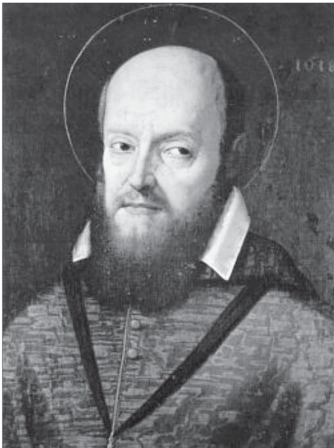
Sv. František Saleský

Poselství Benedikta XVI. k Světovému dni míru 2008 - strana 11 -