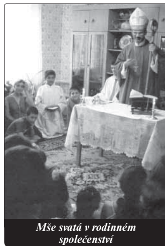
Mše svatá v rodinném společenství

Víza nepředstavují nějaký specifický církevní problém. Každá země má své zákony pro cizince. Bylo by samozřejmě krásné, kdyby duchovní ze zahraničí dostávali snáze víza a povolení k pobytu v Rusku. Z našich zatím 42 kněží jsou čtyři ruští státní občané. Ti studovali v našem semináři v Petrohradě. Ostatní pocházejí z Polska, Irska, Slovenska, Ukrajiny, Německa, Rakouska, Argentiny, Holandska, Francie, Běloruska, Indonésie a Velké Británie. Dobré vztahy našich věřících k různým národnostem jejich kněží z různých zemí představují krásný příklad katolictva naší církve. V SSSR čekali lidé toužebně na kněze, často celá desetiletí. Pro-