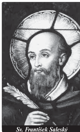
Sv. František Saleský

Umíme si představit, že to byl program mimořádně aktuální... V roce 1605 zahájil pastorační vizitace ve 450 farnostech. Jeho dveře zůstávaly vždy otevřené k přijetí kohokoliv. Říkal, že „biskup je velké veřejné napa-