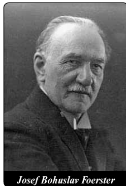
Josef Bohuslav Foerster

Kéž by se tento Poutník opravdu vrátil. Velice ho potřebujeme, aby nás vedl i klikatými cestami k poznání, jak těsně jsou spjaty krása, láska a Bůh.