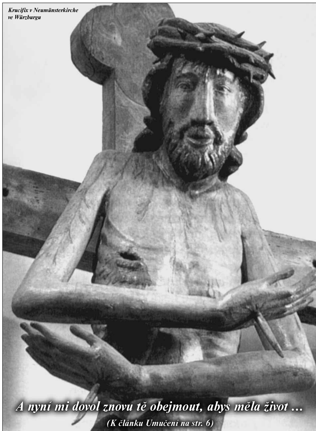
Krucifix v Neumünsterkirche ve Würzburgu