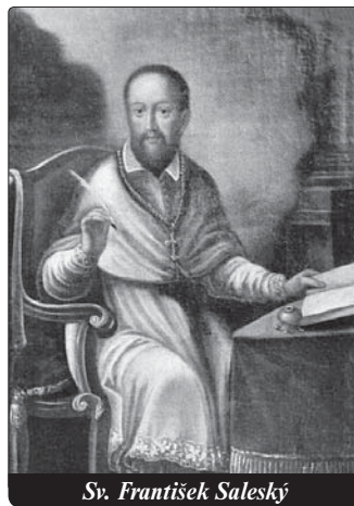
Sv. František Saleský