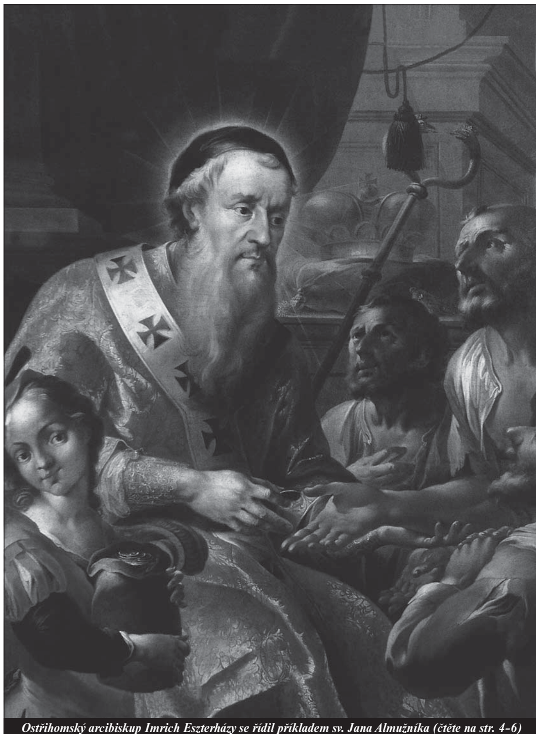
Ostříhomský arcibiskup Imrich Eszterházy se řídil příkladem sv. Jana Almužníka (čtete na str. 4-6)