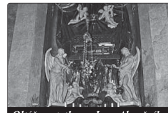
Oltář s ostatky sv. Jana Almužníka

Opačně tomu bylo, když tomuto skromnému a nenáročnému biskupovi daroval jeden bo-