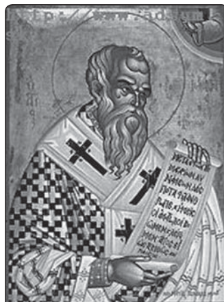
Sv. Jan Almužník

koho miní „pány a mistry“, odpověděl: Mými pány a mistry jsou ti, které nazýváte chudáky a žebráky; oni jsou moji dobrodinci, protože až jednou přijdou do ráje, budou mocně pomáhat těm, kteří zde na zemi pomáhali jim.