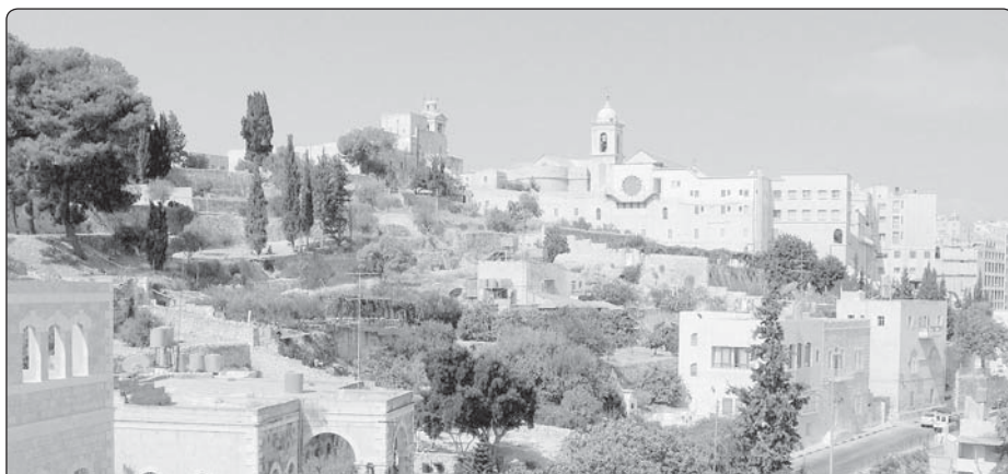
Betlém - místo narození Ježíše Krista

cem povstání. Problémy měli také Ježíšovi příbuzní, potomci apoštola Judy, kteří „spravovali církev“ (vypráví o tom například Eusebius z Césareje, Církevní historie III, 20). Od té doby se početnost Davidových potomků z rodu Zorobabela tak drasticky snížila, že se příchod Mesiáše v pozdějších staletích stal velmi nepravděpodobný. Je to důvod, pro který musel ne jeden Žid uznat, že jenom Ježíš je skutečný Mesiáš.