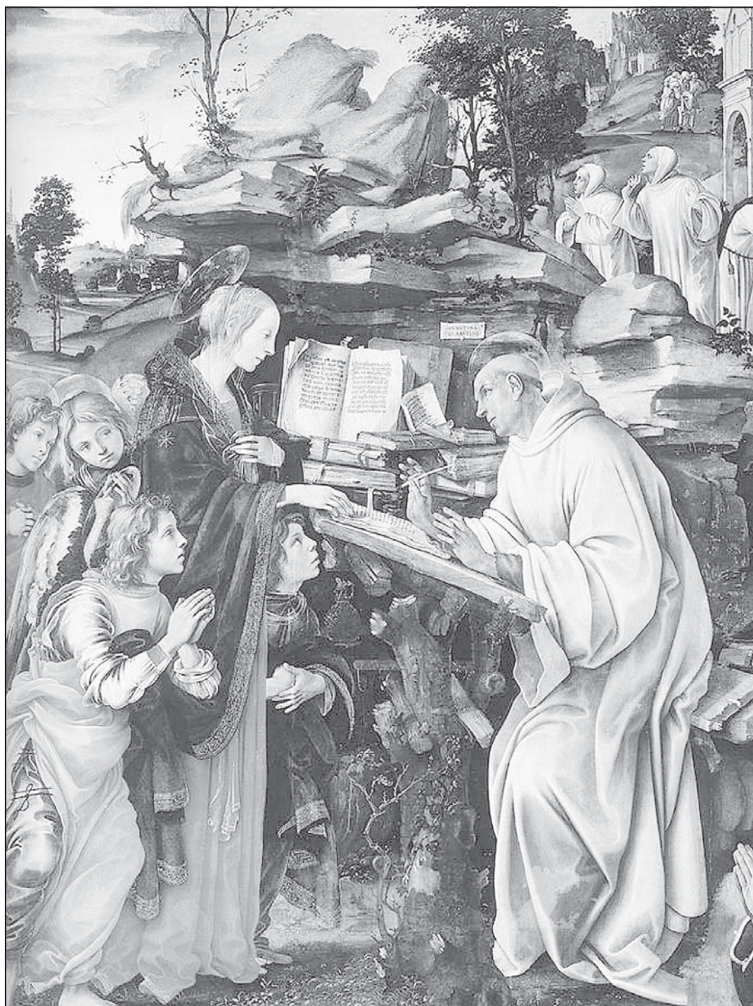
Filippino Lippi (asi 1457-1504): Panna Maria diktuje sv. Bernardovi adventní kázání, detail