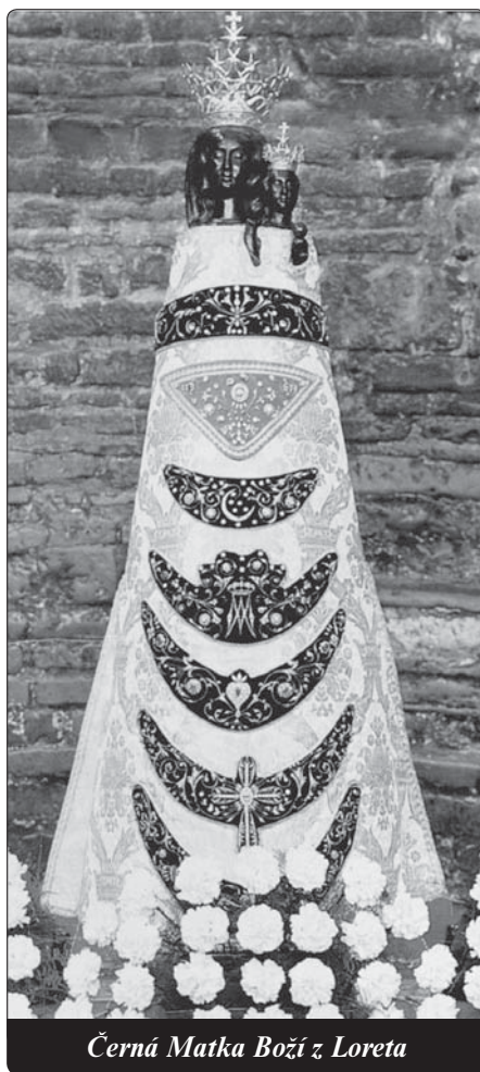
Černá Matka Boží z Loreta

V oblasti byla Venuta zdrojem vřelé radosti pro děti. Večer nemohly usnout, aby uviděly, jak Svatá chýše letí po nebi posetém hvězdami. Konečně „daly maminky znamení k probuzení: »Hnědá Matka Boží přichází přes moře! Svatá chýše přichází do Loreta!« Potom posílali velcí i malí »Madoně malého domečku« tisícere polibky... pod přikrývkou spínali své ruce, aby při litaních, které maminka hlasitě předříkávala, říkali odpovědi...“