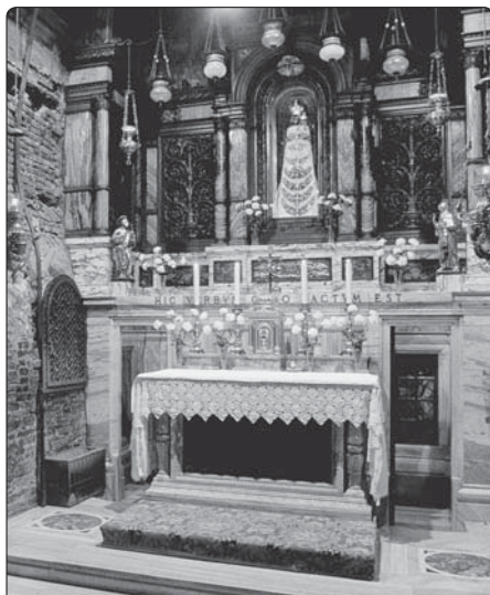
Altář v interiéru Svaté chýše v Loretu s milostnou soškou Černé Matky Boží

Člověk by se měl koncentrovat na hledání střízlivého života ve vleku Svaté rodiny. Nezapomeňme, že střízlivost je mnišskou kvalitou. Postojem mnicha, který se zbavuje všech myšlenek, jež nesměřují k Bohu. Dnes je jenom velice málo li-