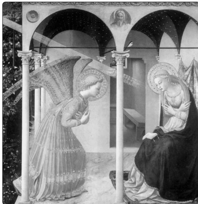
Fra Angelico: Zvěstování

Z Maria Ausiliatrice 4/2002 přeložil -lš-