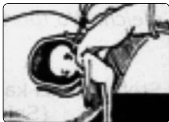
Potrat předčasným porodem

koulí uprostřed vesmíru. Musím vám předat toto poselství a prosím vás, abyste ho předali dále. Hlasování v parlamentu je nesmírně důležité. Týká se nejen potratů. Je to referendum na téma mravního úpadku v Polsku, v Evropě a v civilizovaném světě. Jestliže upadne jeden stát, druhé půjdou za ním. Západní kultura, jak ji známe, pokud nezmění svůj postoj k životu, zmizí ze zemského povrchu.“