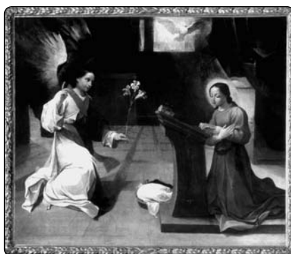
Ludovico Caracci (1555–1619): Zvěstování

Rozjímání o dívech, které Bůh způsobil v Marii, nám pomáhá, abychom rostli v pravé zbožnosti. Úcta k Panně Marii je velice závažná věc, je to povinnost, tak jako je povinnost milovat svou