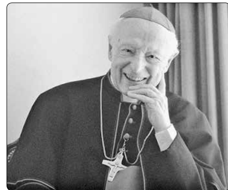
Leo kardinál Scheffczyk

lo pro něho neslýchané a nepochopitelné. Ale toto přesto není protikladné a nesmyslné, protože to řekl Bůh, bylo to vedeno Boží moudrostí a odpovídá to pro člověka nepochopitelnému, ale přesto podivu-