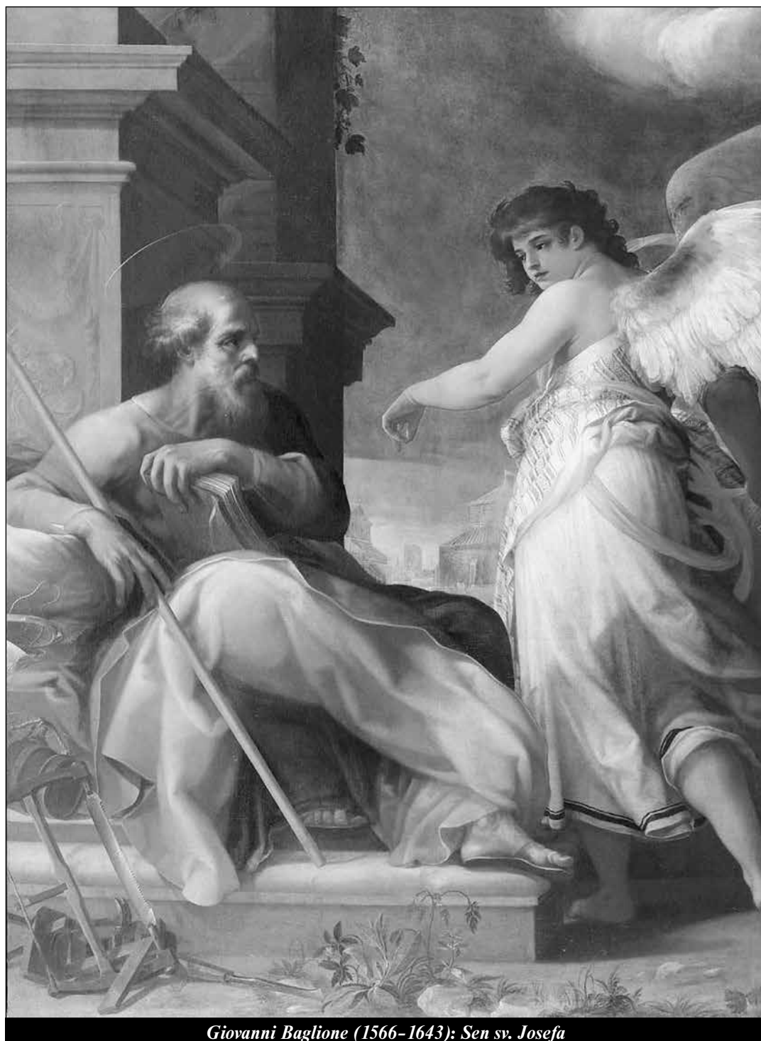
Giovanni Baglione (1566-1643): Sen sv. Josefa