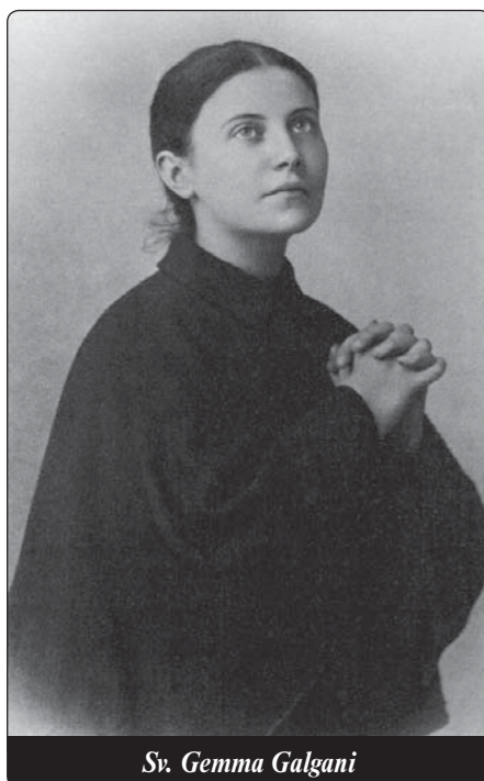
Sv. Gemma Galgani

Na váženou, nábožensky založenou rodinu Galgani, která se starala o chudé, přišly těžké časy. Gemma musela v šestnácti letech opustit řádovou školu a starat se o rodinu a dům. Její otec, neznalý v podnikání a důvěřivý k lidem, kteří si to nezasloužili, se dostal do zoufalé materiální