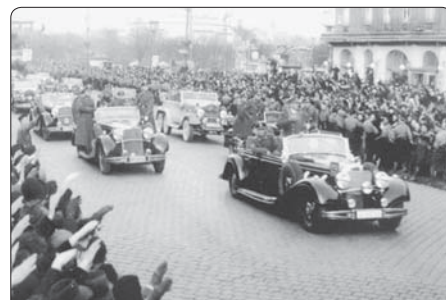
Vjezd Adolfa Hitlera do vídeňského Prátru v březnu 1938

Během jednoho ze svých monologů přednášených pro své blízké spolupracovníky vůdce Třetí říše upřímně vyznal: „Největším neštěstím lidstva je křesťanství. Bolševismus je nemanželským synem křesťanství. Oboje je dílem Židů. Ve věci