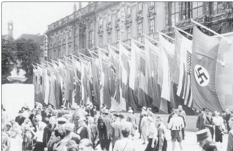
XI. letní olympijské hry v Berlíně v roce 1936

Jak víme – díky zachovaným výpovědím Hitlera vyjadřovaným pro uzavřený okruh jemu důvěřujících lidí – vypořádání s vyznavači Krista odkládal na dobu, až Německo vyhraje válku. Jenomže ve chvíli, kdy bylo třeba získat hlasy křesťanských voličů (především protestantských), Hitler neváhal s „budováním představy“ sebe samotného jako křesťanského politika. Dne 1. února 1933 (dva dny po převzetí úřadu říšského kancléře), během rozhlasového projevu ke všem německým obyvatelům, Hitler – vyznavač okultismu, který už jako mladistvý křesťanství opustil – říkal: „Ať Bůh všemohoucí projeví přízeň naší práci, ať vlastně formuje naši vůli a obšťastní nás důvěrou našeho národa.“ To poslední bylo ovšem velmi potřebné, neboť v březnu 1933 se konaly v Německu předčasné volby do říšského sněmu. ▶