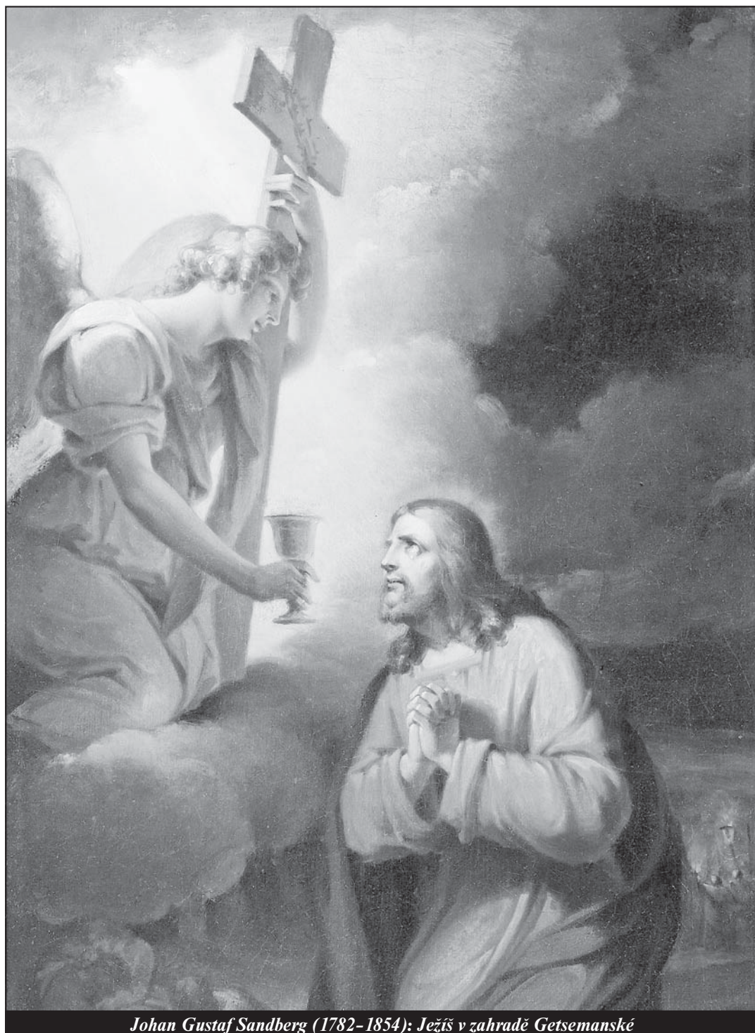
Johan Gustaf Sandberg (1782-1854): Ježíš v zahradě Getsemanské