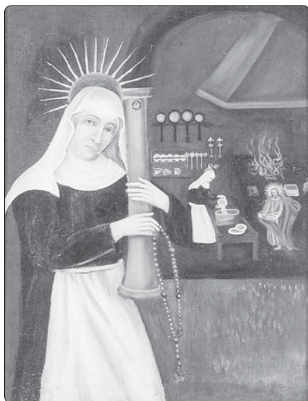
Svatá Marie Krescencie Hössová

Marie Krescencie snášela veškeré ústrky s andělskou trpělivostí, zůstávala navenek „věčně radostná“, jak o ní mluvili její užaslí současníci, obětujíc vše Bohu, dokonce se i radujíc z možnosti přetrpět různá příkoří, neboť jí to skýtalo možnost spojit se ve svém trápení s utrpením Vykupitelovým. Zbylé osazenstvo kláštera