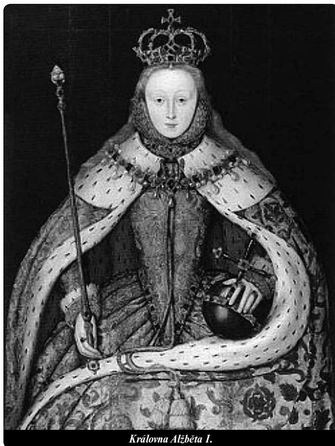
Královna Alžběta I.

V roce 1581 vydala Alžběta Akt o zachování poslušnosti poddaných královské moci , který stanoví trest smrti pro všechny, kdo odpadli ke katolictví. Vysoké tresty a pokuty hrozí za sloužení katolické mše a účast na ní. Naopak účast na anglikánských bohoslužbách je povinná a nesplnění této povinnosti se trestá vysokou pokutou i vězením. O čtyři roky později vydala Alžběta I. Akt proti jezuitům, kněžím a jiným neposlušným osobám . Každému knězi a jezuitovi, který přešel z pevniny do Anglie, i všem, kteří jim poskytnou úkryt, hrozil trest smrti.