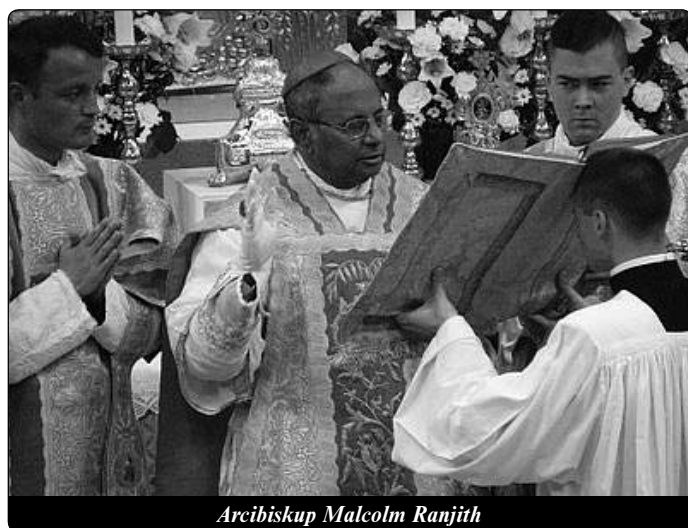
Arcibiskup Malcolm Ranjith

Především by se měly respektovat asijské náboženské symboly, např. oděv kněží. V žádném buddhistickém klášteře nenajdete mnicha jinak než v mnišské kutně. I hinduističtí duchovní se od ostatních odlišují, v chrámě