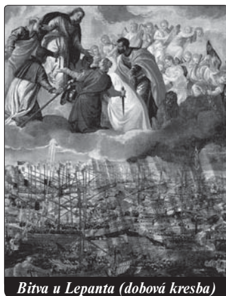
Bitva u Lepanta (dobová kresba)

na jedné lodi kopii vzácného obrazu Panny Marie Guadalupské. K rozhodující bitvě došlo 7. říj-