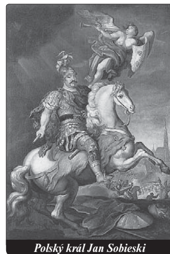
Polský král Jan Sobieski

Evropa byla znovu ohrožena! Kdyby Turci dobyli Vídeň, velmi snadno by padl celý křesťanský Západ do turecké moci. Převaha tureckých vojáků a jejich brutálnost nedávaly mnoho nadějí. Proti 160 000 mužům tureckého vojska stálo jen 12 000 křesťanských vojáků. Více než desetinásobnou přesilu neměli naději porazit. Císař vyzval v této beznadějně situaci ke čtyřicetihod-