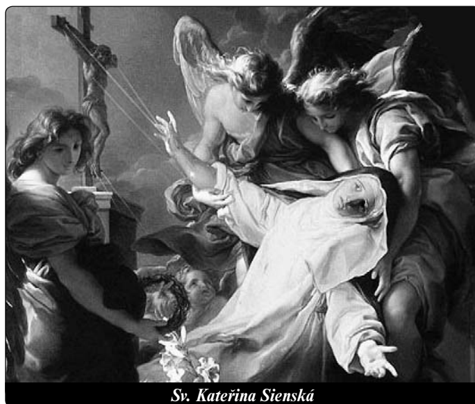
Sv. Kateřina Sienská

Milující usebranost u Pána je důležitější než mnoho vyslovených modliteb a všechna ústní