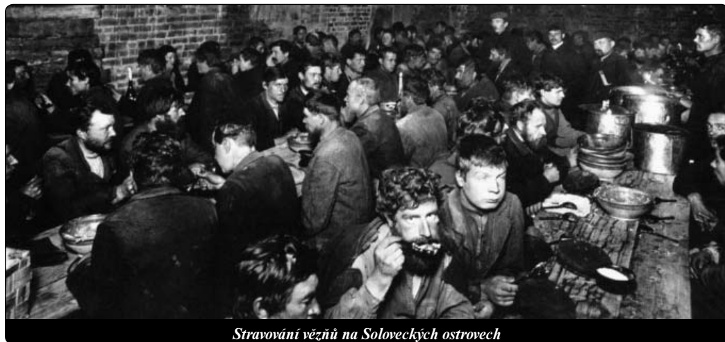
Stravování vězňů na Soloveckých ostrovech