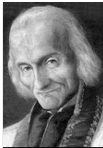
Sv. Jan Maria Vianney

Kdo se zpovídal v Arsu, neměl dojem, že je obviněn a odsouzen, nýbrž že Bůh sám se podíval na to nejtajnější v jeho životě. Každý odpor, každá obrana rázem zmizela. V tomto světle se penitent otevřel, aniž by hledal omluvy nebo ospravedlnění. Náhle stál před Bohem. A Bůh ho prozkoumal v konkrétním průběhu jeho života: tu se se-