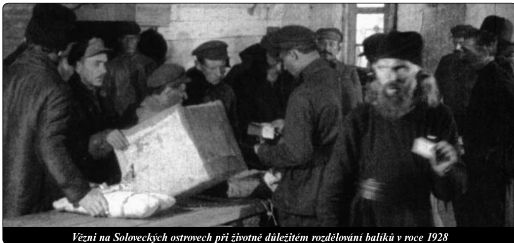
Vězni na Soloveckých ostrovech při životně důležitém rozdělování balíků v roce 1928

Od roku 1938 nás vlaky převážely z jednoho tábora do druhého až na Daleký východ. Tak jsem se dostal až do Baku, hlavního města Ázerbájdžánu, kde mi Bůh v ohromném vojenském lazaretu svěřil 800 německých zajatců. Znal jsem osobně každého z nich! ▶