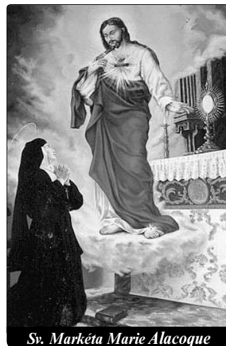
Sv. Markéta Marie Alacoque

svaté?“ Otec odpověděl: „Jako Maria, Jan a zbožné ženy na Kalvárii, tak, že milujeme a spolupíme.“ Do misálku jednoho duchovního syna P. Pio napsal: „Při účasti na mši svaté soustřed se celý na strašné tajemství, které se odvíjí před tvým zrakem: vykopení tvé duše a smíření s Bohem.“ Jindy se ho kdosi zeptal: „Otče, jak to, že pláčete při mši svaté?“ „Dcero moje“ – odpověděl otec – „čím jsou tyto ubohé slzy proti