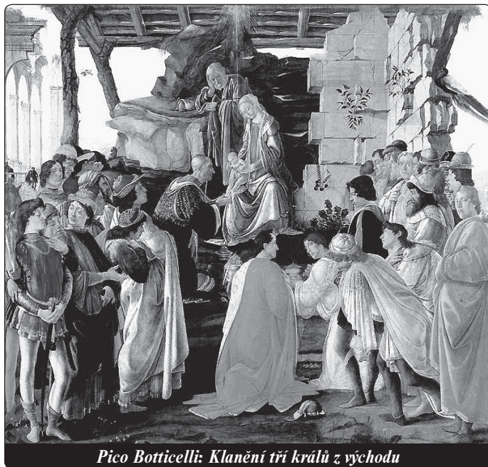
Pico Botticelli: Klanění tří králů z východu