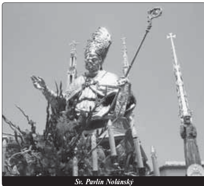
Sv. Pavlín Nolánský

Kromě askeze a Božího slova je zde také charitativní láska: v mnišském společenství jsou