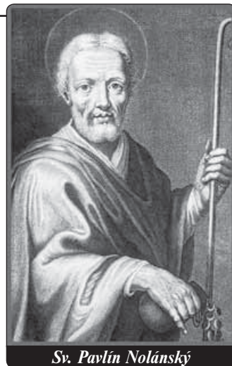
Sv. Pavlín Nolánský

Děkujeme vám také za vaše modlitby a za všechny dary, které jsou o to cennější, že to nejsou dary z přebytku, ale z hojnosti srdce. -lš-