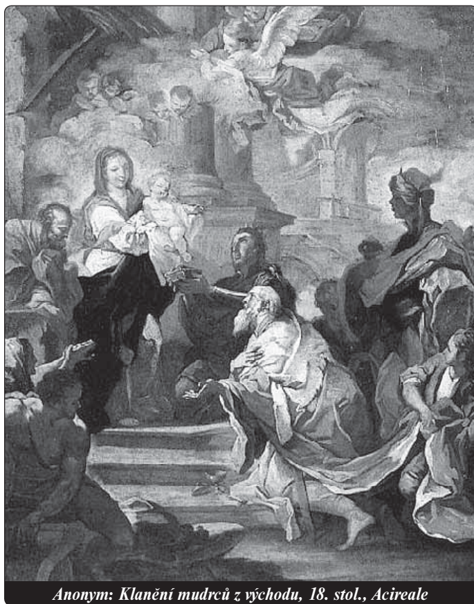
Anonym: Klanění mudrců z východu, 18. stol., Acireale