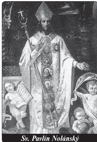
Sv. Pavlín Nolánský

tit pozemské jmění, připomínal, že takové gesto má ještě daleko do představy úplného obrácení: „Opustit nebo prodat pozemské statky nepředstavuje skutečného, nýbrž pouze počátek v běhu