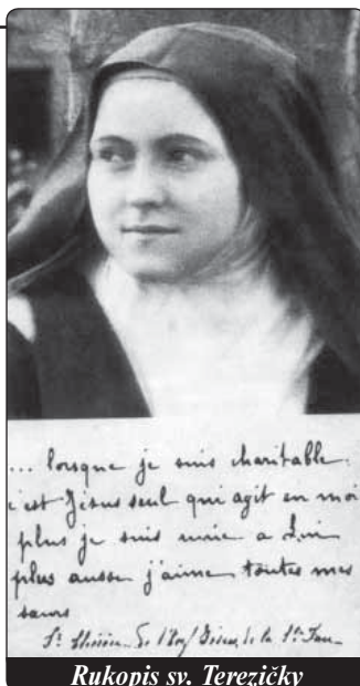
Rukopis sv. Terezičky

„To je výhoda, dokud jsme malé,“ uzavřela Terezie. „Pro malé nejsou žádné překážky, všude podlezou. Velké duše mohou věci překročit, obejít těžkosti pomocí úvahy nebo ctností. Ale my, které jsme malé, se toho musíme varovat. Podlezeme pod tím. To znamená, že o tom nebudeme moc zblízka uvažovat a zdůvodňovat to.“ (Těmito slovy dávala rady novičkám.)