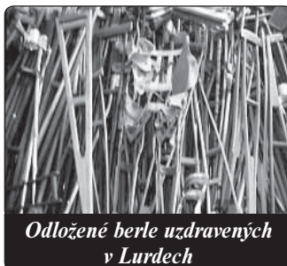
Odložené berle uzdravených v Lurdech

7. dubna 1875 se za strašných bolestí v doprovodu manželky odebral do Oostaker, kde byla zbudována kopie lurdské jeskyně. Když tam dorazil, modlil se s velkou vroucností k Matce Boží. Prosil za odpuštění svých hříchů a za uzdravení, aby mohl svou práci zajišťovat výživu po-