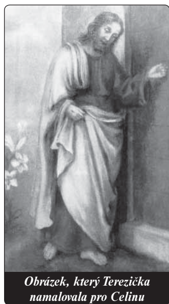
Obrázek, který Terezička namalovala pro Celinu

Během její nemoci, když jsem se jednou provinila a řekla, že je mi jí líto, řekla: „Ihned polib kříž, okamžitě!“ Políbila jsem jeho nohy. „Tak se dítě líbá s otcem? Rychle, rychle polib obličej!“ Políbila jsem ho. „A teď se