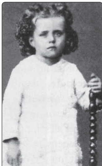
Sv. Terezička jako malé dítě

Mluvila jsem s ní o umrtvování světců a ona mi odpověděla: „Pán to udělal dobře, když