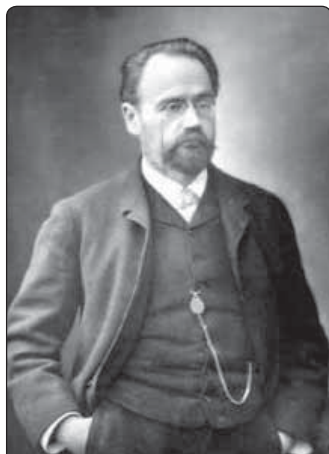
Francouzský spisovatel Emil Zola