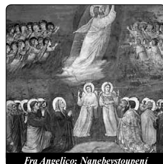
Fra Angelico: Nanebevstoupení

Titíž svatí apoštolové přes důkazy četných zázraků a přes poučení tolika výklady se dali zastrašit strašným utrpením Pána a jen váhavě přijali skutečnost jeho zmrtvýchvstání. Přesto z nanebevstoupení Páně dokázali načerpat takový prospěch, že se změnilo v radost všechno to, co bylo dříve příčinou jejich strachu. Je-