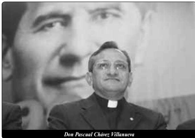
Don Pascual Chávez Villanueva

Toto je cesta, které jsem chtěl naučit moje drahé z Valdocca a ke které zvu i vás, abyste ji vybudovali ve svém mladém prostředí. Valdocco nebyl anonymní prostor jako ulice, byl to opravdový pohostinný dům, ale dům velice lidský, bohatý na hodnoty a rodinné teplo. Moje matka Markéta tam vložila všechnu svou mateřskou péči a něhu. Já jsem vložil otcovskou lásku. Jako pravý otec rodiny jsem dal svým synům dům, oděv, chléb, práci, výuku a zábavu. Spojil jsem s velkou vášní toto poslání, které jsem si vyžádal od Pána, abych se setkal s mnoha mladými a abych se zbavil všeho, co nebylo v jejich zájmu.