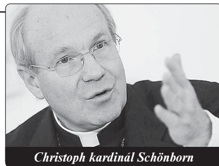
Christoph kardinál Schönborn

V tak bolestném sporu o ochranu života našla Matka Tereza z Kalkaty jedinečně přesvědčivou odpověď – přímo pomáhající skutek, když řekla: „Nezabíjejte! Dejte je mně!“