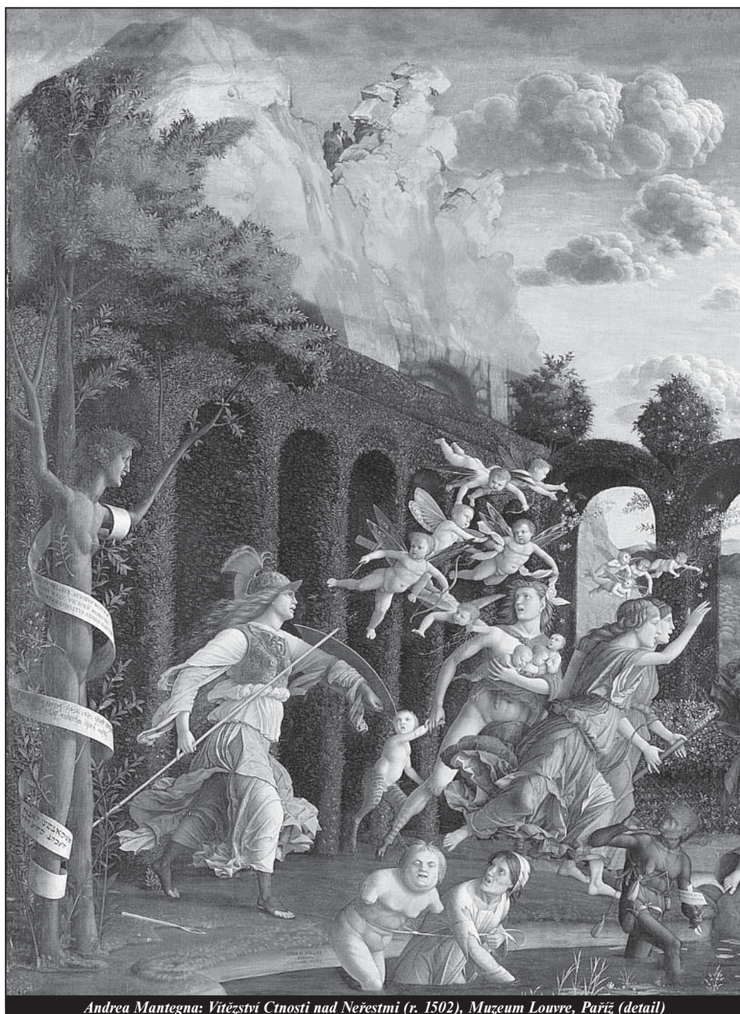
Andrea Mantegna: Vítězství Ctivosti nad Neřestmi (r. 1502), Muzeum Louvre, Paříž (detail)