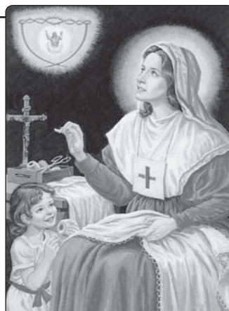
Blahoslavená Anna Maria Taigi

Za všechny se modlila a vypošovala jim duchovní pomoc a vyzývala k modlitbě. „Slunce“ jí ukazovalo nitro lidských srdcí a jejich největší tajemství. Používala tohoto daru, aby přived-