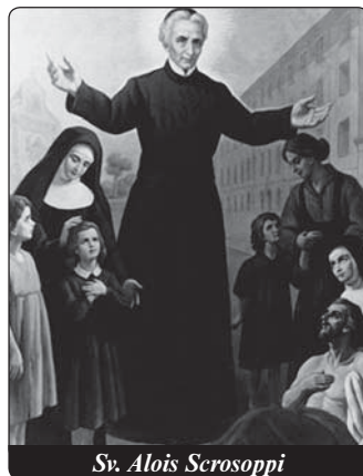
Sv. Alois Scrosoppi

Svatá Panna v evangeliu rozlévá svou zář jako znamení vykoupení a posvěcujícího povznesení ženy a jejího postavení. V evangeliu žádná žena není nehezkou postavou. Ani cizoložnice, ani hřišnice z Magda-