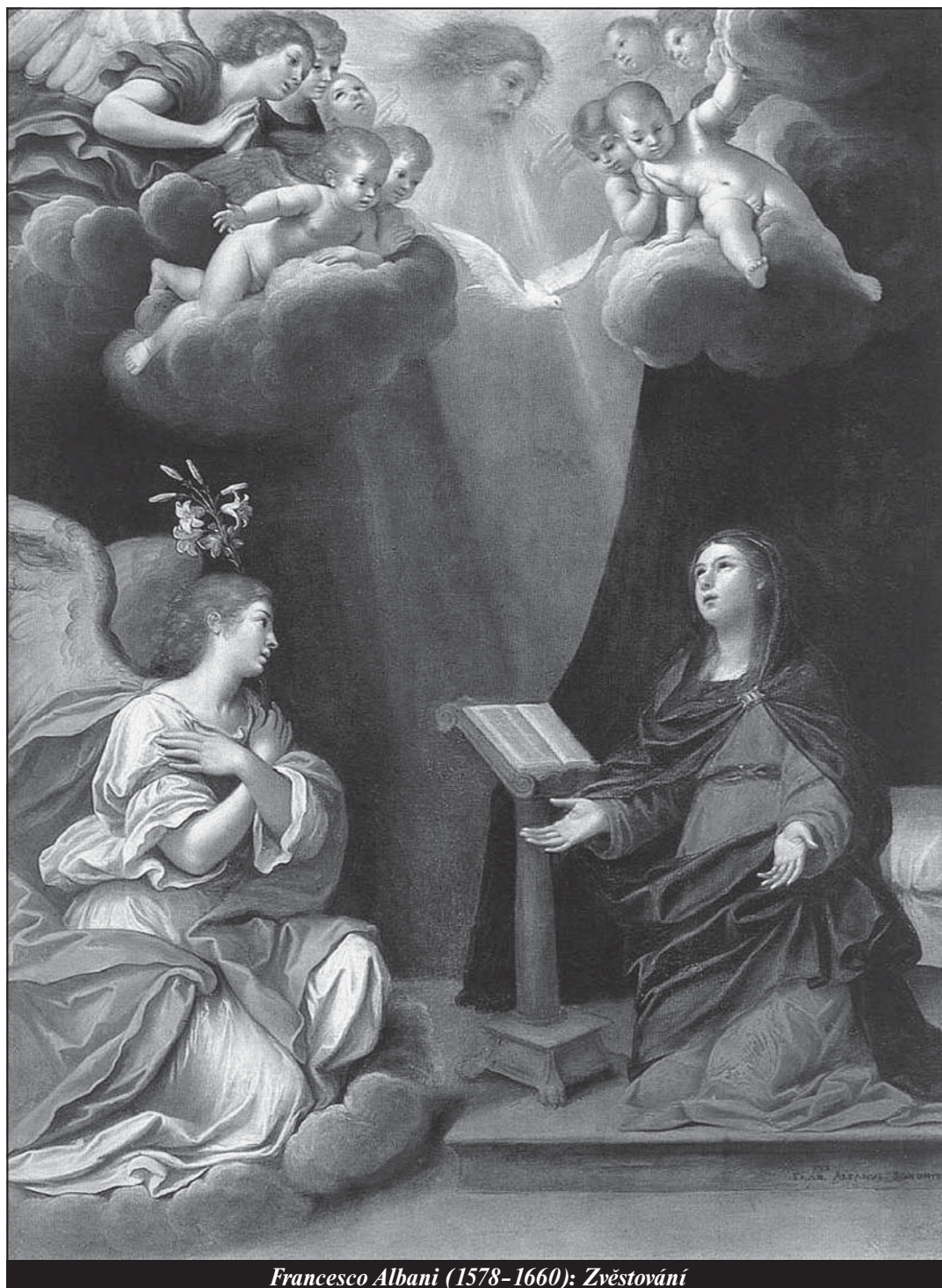
Francesco Albani (1578-1660): Zvěstování