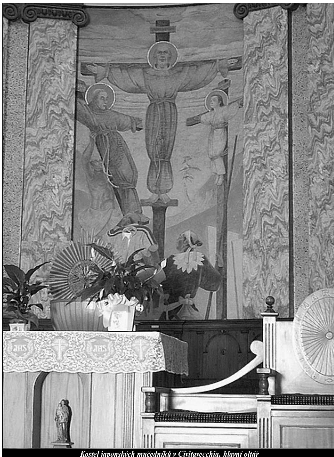
Kostel japonských mučedníků v Civitavecchia, hlavní oltář