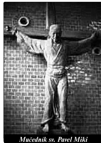
Mučedník sv. Pavel Miki

Další vlna pronásledování začala v roce 1614. Šógun Dai-fusama nařídil zbournat všechny zbývající svatyně v zemi. Misionáři a katolíci z významných japonských rodin byli vyhnáni ze země. Pronásledování katolíků v Japonsku trvalo celé sedmácté století. V září 1622 bylo na hranici upáleno 25 katolíků, z toho 9 jezuitů, 6 dominikánů a 4 františkáni. Před svou pravou se museli dívat, jak bylo sřato 30 jiných křesťanů. Japonský mořeplavec Richard Cocs byl svědkem mučednické smrti 55 katolíků, mezi kterými byly pětileté a šestileté děti. Oběti byly upáleny na hranici v náručí svých matek a volaly: „Ježíši, přijmi naše duše.“