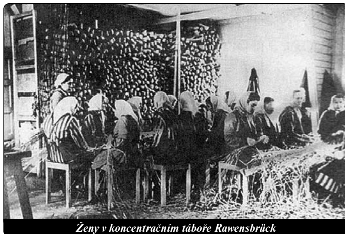
Ženy v koncentračním táboře Rawensbrück

Konečně jsme byly volné a mohly jsme se vrátit do Polska, které teď začínalo již na Odře. Ve dne jsme putovaly, v noci spaly v domech po Němcích.