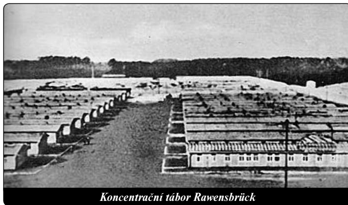
Koncentrační tábor Rawensbrück

Pátého dne plného útrap jsme si všimly, že na cestách je mnoho vozů s Němci, kteří naložili nejcennější věci a dobytek a snažili se dorazit do americké zóny. Rozhodla jsem se, že toho využiji, a spolu se čtyřmi kolegyněmi jsme se odtrhly od ne-