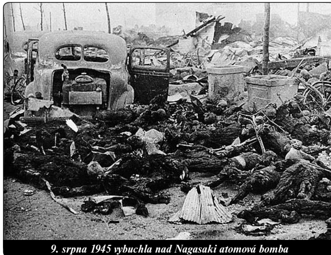
9. srpna 1945 vybuchla nad Nagasaki atomová bomba