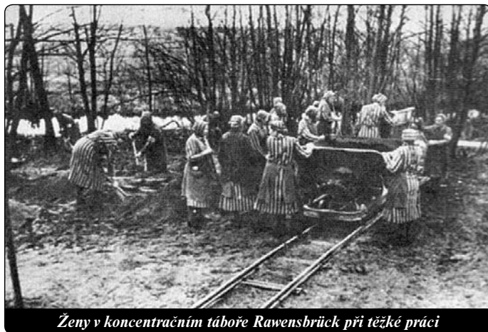
Ženy v koncentračním táboře Rawensbrück při těžké práci

Mezi mraky vyšel měsíc a díval se, která z nás jako první zemdlí, usedne do příkopu a bude čekat na smrtící ránu. Trápi-ly nás myšlenky: Co bude? Kam nás vedou? Kde je ta vytoužená svoboda?... Šla jsem jako otupělá a dodržovala jsem s ostatními krok jen proto, že jsem musela.