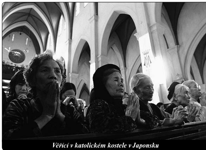
Věřící v katolickém kostele v Japonsku

Jeden z misionářů, který byl svědkem mučednictví křesťanů v Nagasaki v roce 1597, napsal: Udivující ovoce této štědré oběti našich dvaceti šesti mučedníků spočívá v tom, jak křesťané nedávno obrácení, tak ti, kteří už mají zralou víru, byli utvrzeni ve víře a v naději na věčnou spásu. Rozhodli se obětovat svůj život pro Krista. I samotní pohané, kteří byli svědky mučednictví, byli uchváteni radostí těch blahoslavených, kteří trpěli na křížích, i odvahou, s jakou šli vstříc smrti.