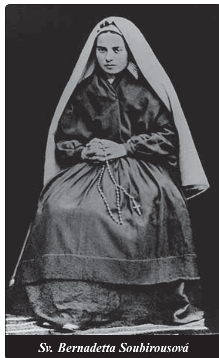
Sv. Bernadetta Soubirousová

11. února 1858 mezi 12.00 a 12.30 hodin se zjevila Bernadettě ve výklenku skalní jeskyně „Massabielle“ („stará skála“) blízko řeky Gávy „mladá, mimořádně krásná paní“. Postava byla oblečena do „sněhobílého oděvu“ a do „drahocenného pláště se závojem“, který byl převázan pásem, jehož „modř působila skoro bolestivě“. Na bosých nohou zářily dvě zlaté růže. Dáma předkládá Bernadettě důkazy o své skutečné přítomnosti. Když se mlynářova dcerka zadívá na tajemnou postavu, připadá jí, že „není sama sebou“. Vypadá totiž jako „anděl na oltáři, ...ale ještě krásnější“. Bernadetta a Dáma se spolu modlí růženec, přičemž Dáma slova Zdravas, Maria vynechává, ale jenom nechává perly proběhnout mezi prsty. Modlitba je vždycky přerušována rozhovorem obou. „Neslibuji ti,“ říká vizionářce, „že tě udělám šťastnou na tomto světě, určitě ale na tom druhém.“