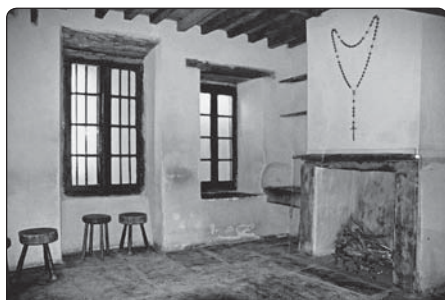
„Cachot“ (sklepení) – pochmurná místnost ve starém městském vězení