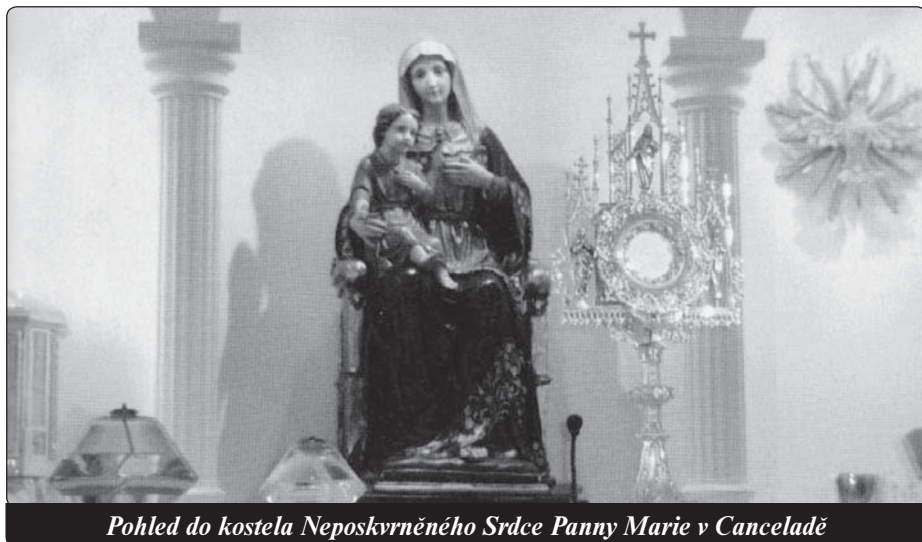
Pohled do kostela Neposkrvněného Srdce Panny Marie v Canceladě

Zpracovala M. Radomská (Z Miłujcie się 4/2013 přeložila -vv-)