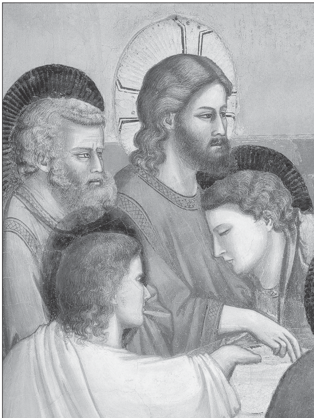
Giotto di Bondone (asi 1267-1337): Poslední večeře Páně, detail, kaple rodiny Scrovegni, Padova