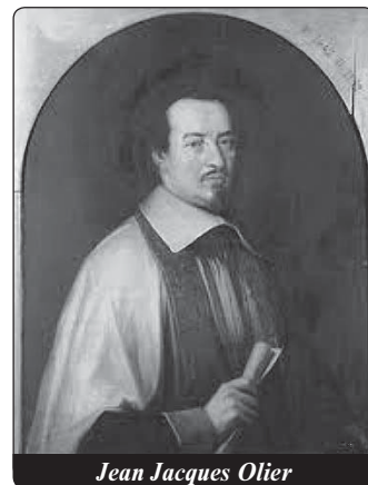
Jean Jacques Olier

Dame, padl jsem na kolena před sochou Panny Marie a s bolestným srdcem jsem jí řekl: Bud' ty mojí matkou, protože moje matka mě zavrhuje.