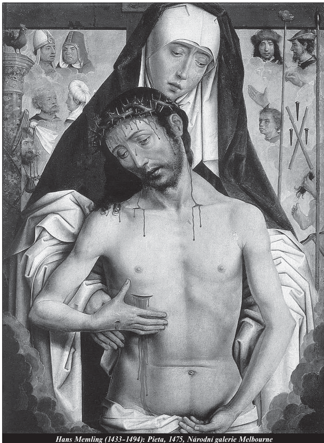
Hans Memling (1433-1494): Pieta, 1475, Národní galerie Melbourne