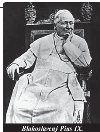
Blahoslavený Pius IX.

nutno chápat jednání Mastaiho Ferrettiho také v průběhu první války o nezávislost a ve střetu s povstaleckým hnutím.