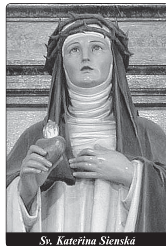
Sv. Kateřina Sienská

Jiným příkladem reformátora byl svatý František z Assisi, který se stal později jáhnem. František uslyšel ve zřícenině kostelíka svatého Damiána Kristův hlas, aby znovu zbudoval chrám církve. Nejdříve obnovil několik