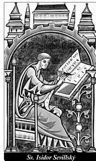
Sv. Isidor Sevillský

jinak by nebylo správné. Neboť jak máme milovat Boha v kontemplaci, tak máme milovat bližního v činnosti. Není tedy mož-