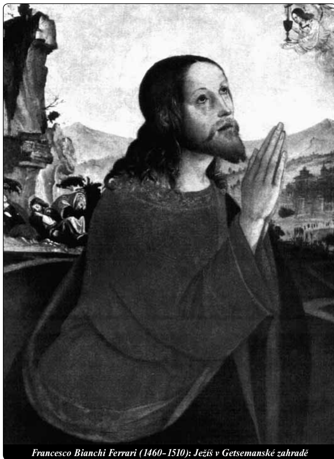
Francesco Bianchi Ferrari (1460–1510): Ježíš v Getsemanské zahradě

Dceruško, nabídl jsem se jako lilie, abych utišil jeho hněv