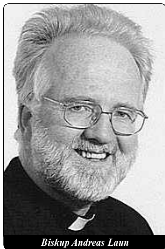
Biskup Andreas Laun

nou bezpečnou ochranou práva a svobody, protože pravá demokracie je možná jen v právním státě a na základě správného pojetí člověka... Demokracie bez hodnot se lehce změnila v otevřený nebo skrytý totalitarismus, jak dokládají dějiny.“