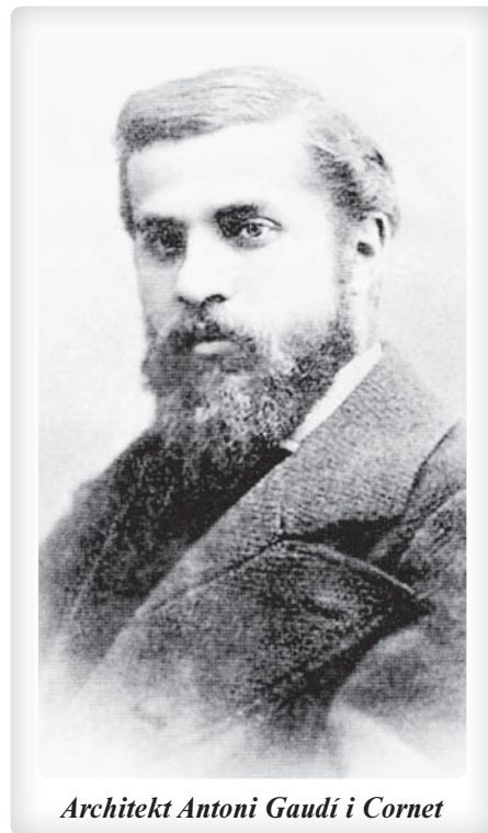
Architekt Antoni Gaudí i Cornet

Geniální vizionář už během života získal velkou slávu a dosáhl mnoha úspěchů, které mu mohly přinést bohatství a pocty. Někteří ho však špatně chápali a kritizovali. Dnes je všeobecně obdivován a do Barcelony přijíždí mnoho milovníků jeho umění, aby mohli na vlastní oči spatřit veliká architektonická díla. Nemnoho z nich si však skutečně uvědomuje, co bylo doopravdy inspirací tvorby Antonia Gaudího, odkud čerpal své překvapivé nápady. Je těžké to všechno hledat v průvodcích