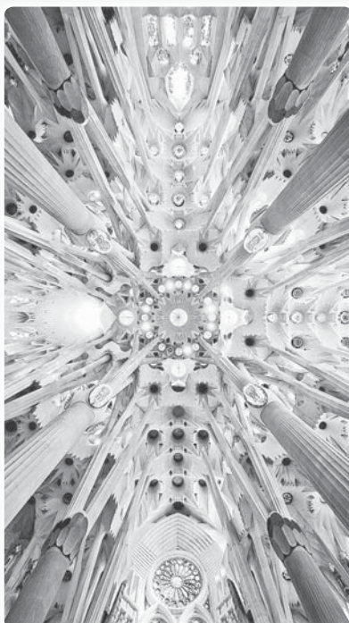
Monumentální svatyně má otrást ospalými srdci, zvětšit víru a přičinit se o to, aby se Pán slítoval nad zemí

Antoni Gaudí od počátku věřil v úspěch svého projektu. Ačkoliv si byl plně vědom, jak velké finanční náklady bude vyžadovat, bezmezně důvěřoval svatému Josefovi a jeho pomoci. Když se ho ptali, kdy dokončí svůj projekt, tvůrce obvykle odpovídal: „Můj klient nespěchá,“ a v krizových momentech, kdy byla kasa prázdná, Gaudí povzbuzoval na duchu své spolupracovníky a opakoval: „Pracujme, pracujme s vírou, a naše práce vydá plody!“