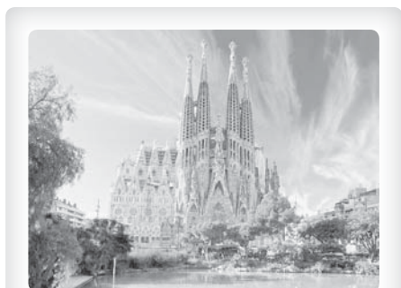
Bazilika Sagrada Familia v Barceloně

Z Miłujcie się! 3/2017 přeložila -vv- (Redakčně upraveno)