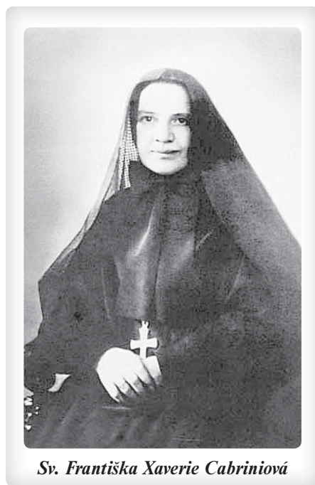
Sv. Františka Xaverie Cabriniová

Zhruba ve stejné době ovšem došel do Vatikánu dopis newyorského arcibiskupa Michaela Augustina Corrigan, jenž papeže Lva XIII. žádal o vyslání kněží a řádových sester, kteří by se ujali pastorence mezi italskými přistěhovalci do Ameriky. Svatý otec věděl o pobytu sestry Františky Xaverie v Římě, ba i o jejím slibu. V žádosti z New Yorku viděl řízení Boží, proto si ji pozval na audienci a při ní ji přesvědčil, aby změnila svou vizi: „ Nikoliv na