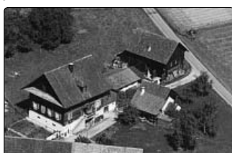
Rodný dům Vereny Bütlerové na švýcarském venkově

V životě Marie Bernardy, která byla 12. října 2008 svatořečena, máme takřka pokušení mluvit o dvojí cestě: vnější, misijní, a vnitřní, mystické. A přece obě jsou od sebe neoddelitelné. Ne-