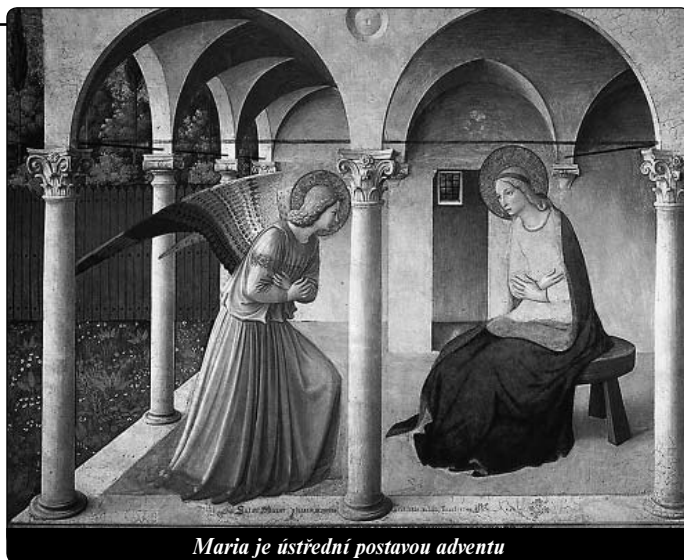
Maria je ústřední postavou adventu

Mléko a med jsou vánoční dary. Betlémské Dítě je pro nás mlékem a medem, je to vtělená Boží něžnost.