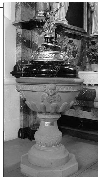
Křtelnice, kde byla Verena Bütlerová pokřtěna

„Pryč s Kristem, pryč s Církví!“ Marie Bernarda musí spolu se společenstvím, které se rozrostlo na 15 sester, zemi opustit. Chudé jako František a Klára nastupují na loď a odjíždějí do Cartageny na severu Kolumbie.