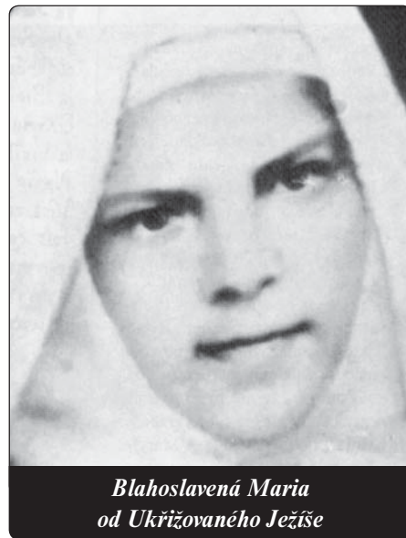
Blahoslavená Maria od Ukřižovaného Ježíše