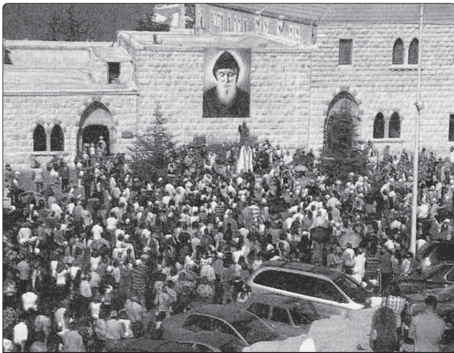
Obrovský zástup lidí se sešel, aby se shromáždili k 20. výročí Nohadina uzdravení

matka, kterou opustili ve 23 hodin ležící v posteli a umírající, zabývala svým zaměstnáním. Připravovala čaj a mléko, jak to obvykle dělávala.