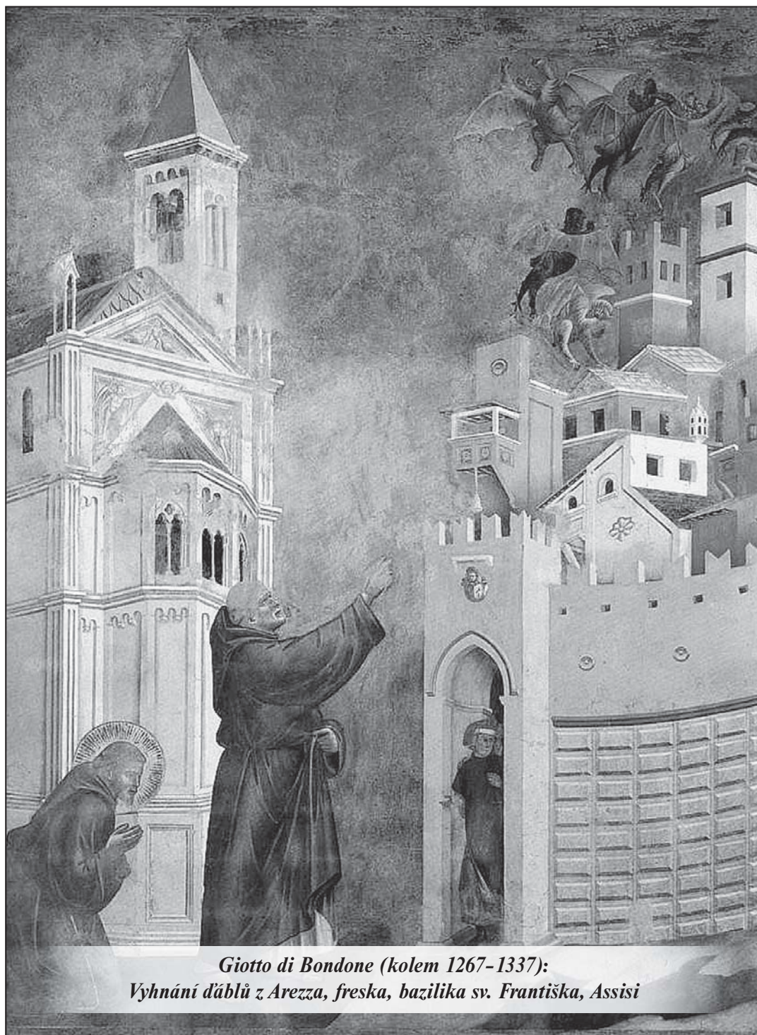
Giotto di Bondone (kolem 1267-1337):

Vyhnání ďáblů z Arezza, freska, bazilika sv. Františka, Assisi