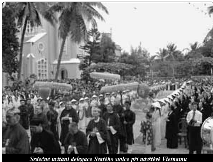
Srdečné uvítání delegace Svatého stolce při návštěvě Vietnamu

nenavštívila: Quy Nhon a Kontum ve vnitrozemí v církevní provincii Huê. Byly to velmi intenzivní a náročné dny, kdy jsme autem a letadlem stíhali těsně seřazené termíny. (Při přistání na letišti Quy Nhon nás přepadla doslova průtrž mračen a vyvolala v nás skutečnou hrůzu!) Ale zážitky v církevní oblasti nám na to daly rychle zapomenout. V Quy Nhon nás přijal generální vikář a takřka všechen klérus, o četných věřících ani nemluvě.