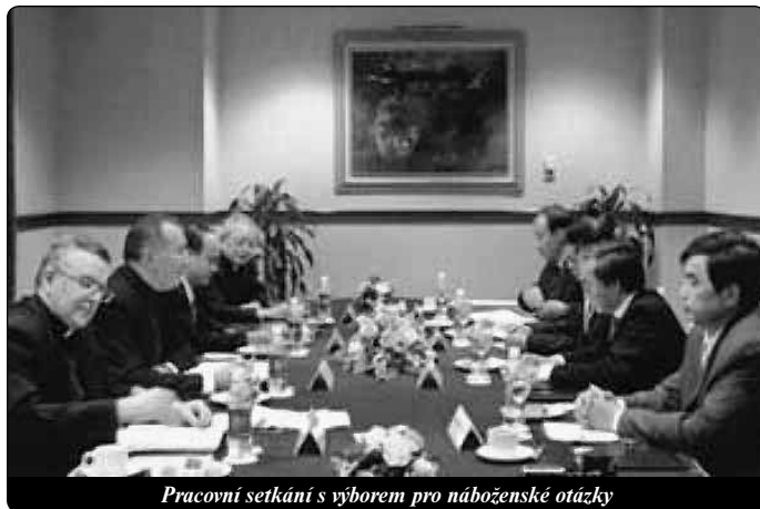
Pracovní setkání s výborem pro náboženské otázky