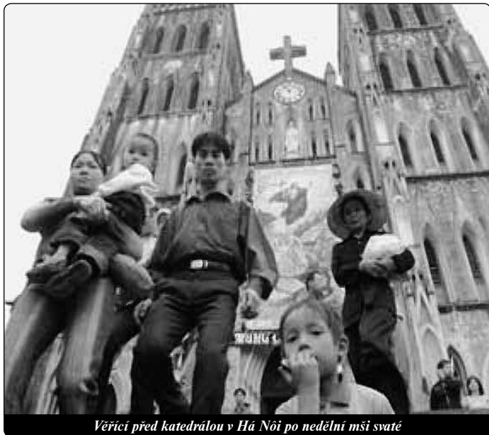
Věřící před katedrálou v Hú Nôi po nedělní mši svaté

hudebních nástrojů. Po mši svaté jsme ještě dlouho oslavovali a nemohli jsme odmítnout domácí rýžový likér. Po zbytek dopoledne jsme si prohlíželi církevní zařízení v Pleiku: školky, internáty, domovy pro postižené atd., které ukazují, že katolická církev věnuje velkou pozornost všem lidem, kteří se nacházejí v obtížné situaci.