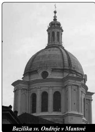
Bazilika sv. Ondřeje v Mantově

B azilika konkatedrála sv. Ondřeje apoštola v Mantově má to šťastné privilegium, že se tu trvale přechovává relikvie Nejsvětější Krve Ježíše Krista. Není proto divu, že s dějinami Mantovy se poji zvláštní projevy zbožnosti, takže se stala centrem reholního života. Tyto projevy zbožnosti ovlivnily dynamiku města. Je historicky doloženo, že na stejném místě, kde je nyní kostel Lva Křtitele Alberta, byly dříve dva různé chrámy zasvěcené svatému Ondřeji. Dobu, kdy byl postaven první chrám, není možno určit. Někteří historikové kladou jeho vznik do doby, která následovala po prvním „nalezení“ relikvie, jiní ho kladou do předkarolínské epochy a nespojují jej s relikvií. Pozdější zmínky o klášterním kostele a pak o kostele sv. Alberta jsou bezpečně spojeny s relikvií Nejsvětější Krve.