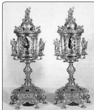
Vzácné relikviáře s Nejsvětější Krví

kovou bouři obyvatel, že se musel utéct do kláštera sv. Benedikta v Polirone.