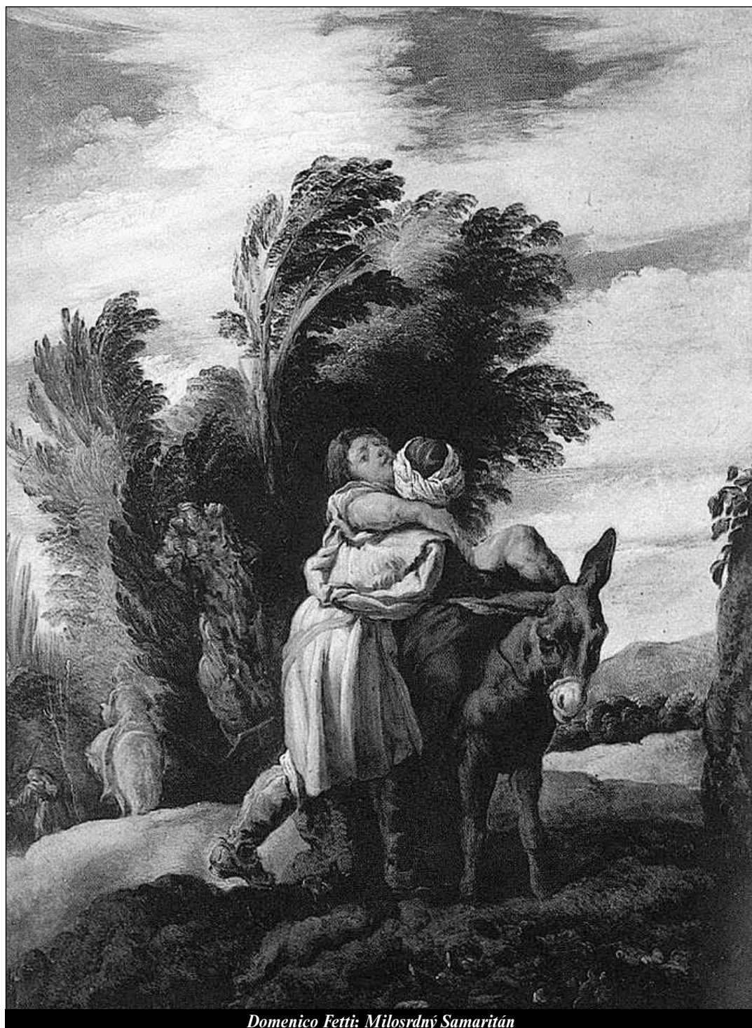
Domenico Fetti: Milosrdný Samaritán

Markéta z Cortony, žena vždy zamilovaná - strana 12 -