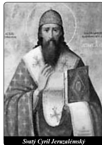
Svatý Cyril Jeruzalémský

Základ vysvětlení křesťanské víry se rozvíjel také ve funkci polemiky proti pohanům, židokřesťanům a manichejcům. Argumentace stavěla na naplnění zaslíbení Starého zákona, a to v řeči bohaté na obrazy. Katecheze měla důležité poslání a byla zasazena do širokého kontextu celého, zvláště liturgického života křesťanské obce, v jejímž