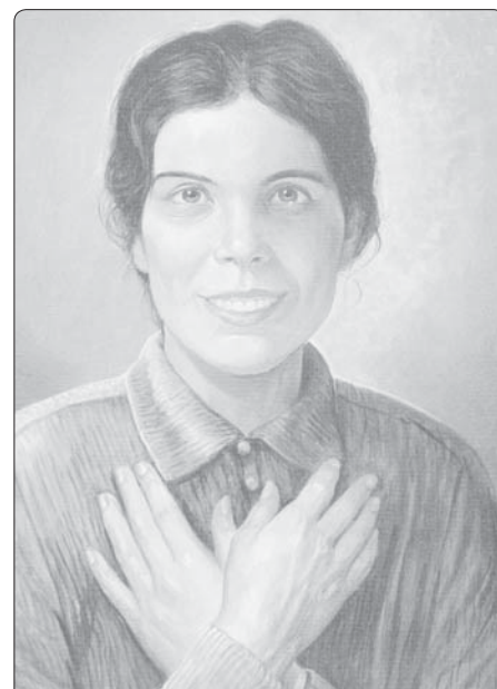
Bl. Alexandrina Maria da Costa

lepším prostředkem, jak dosáhnout blaženosti a plnosti Boží lásky. Cožpak nevyškočila z okna, které bylo čtyři metry nad zemí, aby si zachovala svoji čistotu?... Cožpak se nebránila všemi silami zničujícím útokům určitých lidí, kteří v ní vidě-