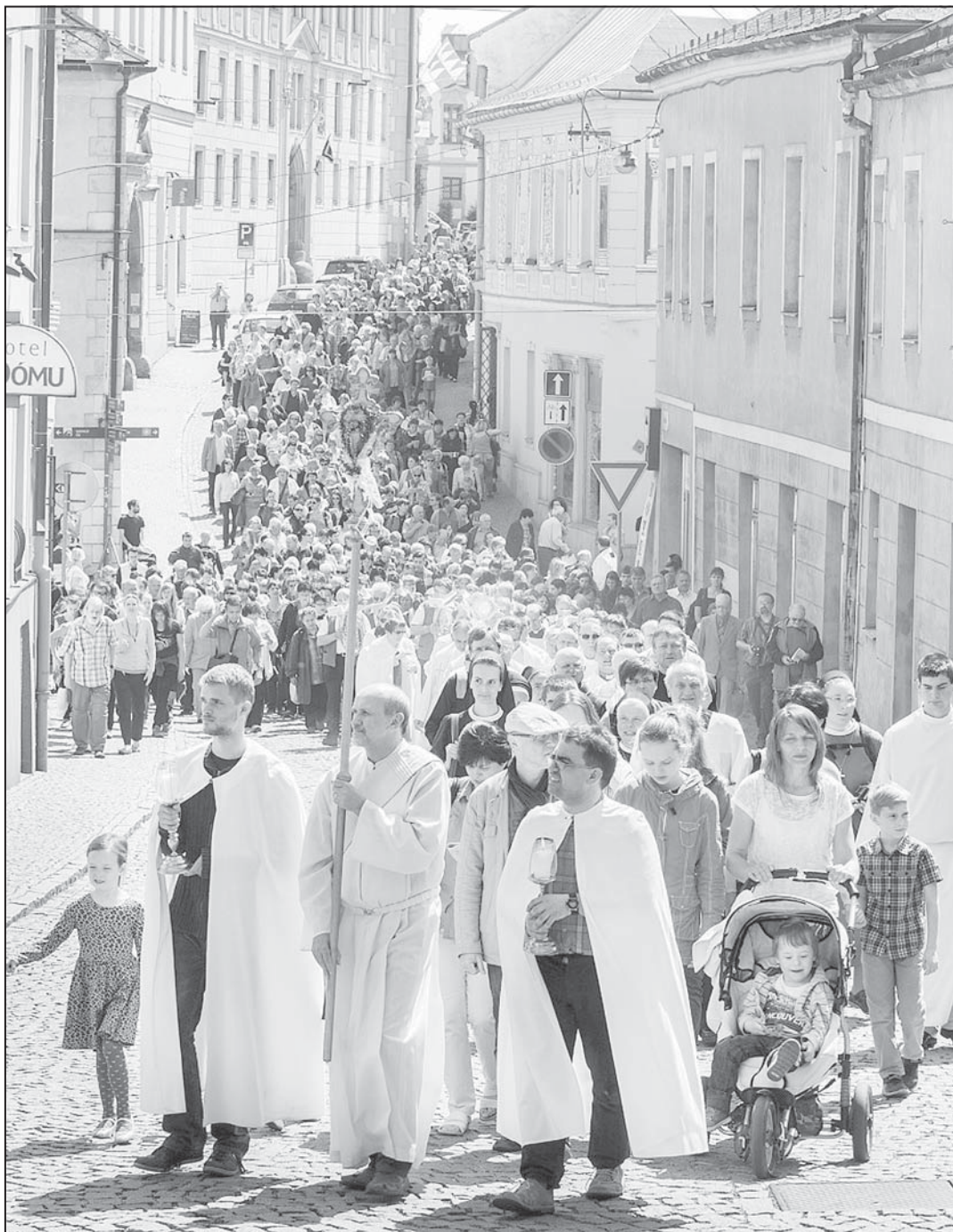
Ve dnech 16.-17. října 2015 se uskuteční v Brně Národní eucharistický kongres (foto z diecézního eucharistického kongresu olomoucké arcidiecéze)