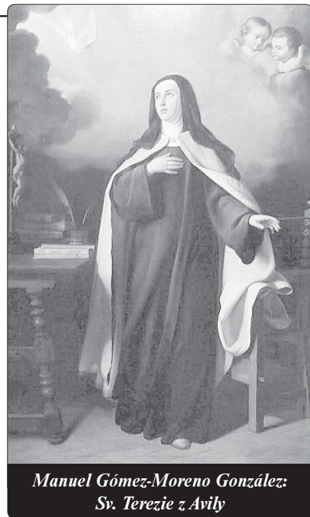
Manuel Gómez-Moreno González: Sv. Terezie z Avily

Není pro nás modlitba, i když je to osobní modlitba, často jenom „jednostrannou ulici“, v níž jsme těmi jedna-