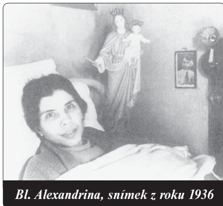
Bl. Alexandrina, snímek z roku 1936

Nebo také: „Slibuji ti, že zachráním všechny duše, které se budou modlit u tvého hrobu, také ty, které tam přijdou se špatnými úmysly: Já je obrátím!“ A je mnoho lidí, kteří přicházejí ze všech částí světa ve zbožném úmyslu do malého kostela v Balasaru, aby tam poděkovali nebo si vyprosili milost!