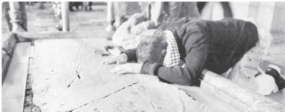
Věřící modlící se u Kamene pomazání v bazilice Hrobu Páně v Jeruzalémě

Radostná pravda, že Ježíš Kristus vstal z mrtvých a žije, že uzdravuje, proměňuje lidská srdce ve svátostech, je výzvou adresovanou naší svobodě. Pán Bůh nám dává dostačující množství přesvědčujících znamení i světla, abychom mohli uvěřit. Zůstává však „Bohem skrytým“ (srov. Iz 45,15), dostupným v „temnotách víry“, protože jenom tehdy ve vztahu s Ním jsme svobodní a schopni lásky.