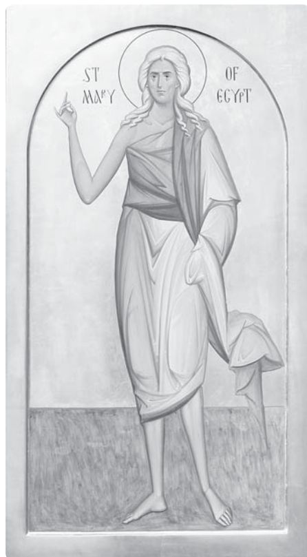
Svatá Marie Egyptská

Stoupla si do rohu nádvoří. Nevěděla, co se děje. Začala překotně uvažovat, co to má znamenat, když se jí náhle dostalo osvětlení: obtížena tolikerými hříchy není hodna, aby se přiblížila ke Spasitelovu kříži. V jedné jediné vteřině se obrátila. Zaplavila ji obrovská vlna lítosti nad sebou a svými hříchy, padla na kolena a rozeštkala se. V slzách pozdvihla oči vzhůru a užřela obraz Panny Marie. Vytanulo jí na mysl, že je Nejsvětější Panna nazývána