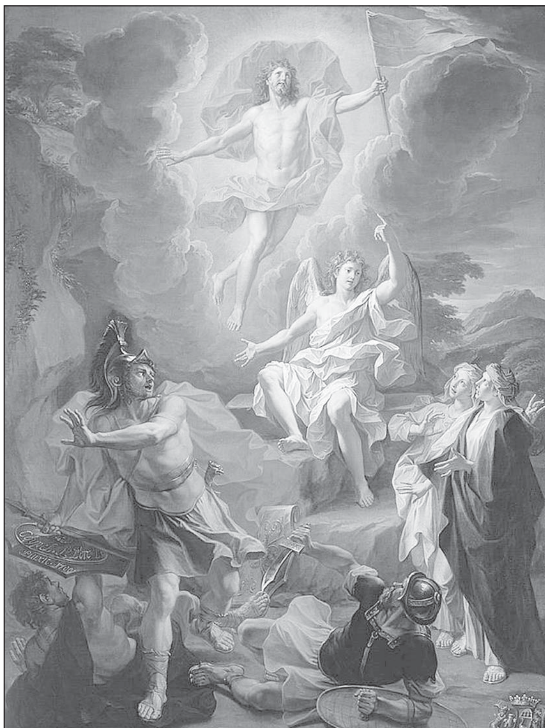
Noël Coypel (1628–1707): Zmrtvýchvstání

Asia Bibi se může ve vězení modlit s růžencem od papeže - strana 12 -