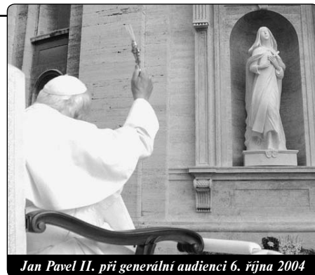
Jan Pavel II. při generální audienci 6. října 2004

Mnozí církevní Otcové, jak je známo, četli portrét královny tak, že ho aplikovali na Pannu Marii, počínaje vstupní výzvou: Slyš, dcero, pohleď a poslouvej (v. 11). Děje se tak např. v homilii o Matce Boží od Krisippa Jeruzalémského, Kapadočana, který byl v Palestině jedním z mnichů iniciátorů monastýru svatého Eutymia, a když se stal kně-