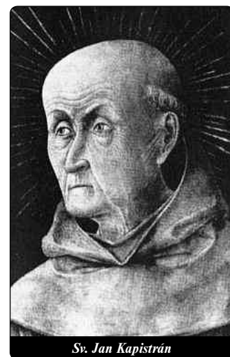
Sv. Jan Kapistrán

Ve svých spisech prokazuje Jan Kapistrán hlubokou znalost