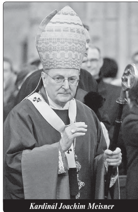
Kardinál Joachim Meisner

Jestliže dnes slavíme svátek Mláďátek, pak musíme vlastně pojem dětí rozšířit na nevinné ubohé a staré lidi, s nimiž se jednoduše manipuluje. Nám je uloženo vírou v živého Boha, abychom se zastávali lidí ve prospěch Bohem stanovené životní formy, ať je to vhod nebo nevhod. My nemáme a nesmíme dávat pozor na politicky korektní chování a řeč, nýbrž na politické myšlení v souladu s Bohem. Ve