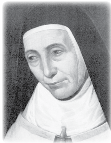
Blahoslavená Anna od sv. Bartoloměje

Terezie, představená konventu, však byla v době farářova příjezdu nadlouho pryč, měla totiž povinnosti v souvislosti se zakládáním jiných klášterů. Její zástup-kyně Marie od sv. Jeronýma ale neměla nic proti tomu, kdyby se Anna přišla uká-zat. Natěšená dívka si návštěvu ávilské-ho Karmelu musela vybojovat na starších sourozencích, které obměkčila až po vy-trvalých prosbách.