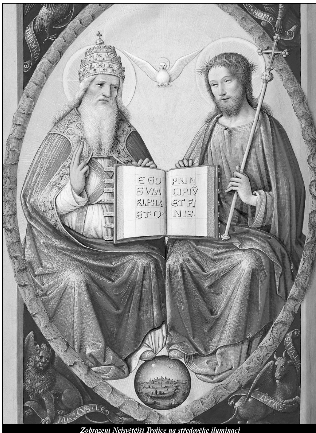
Zobrazení Nejsvětější Trojice na středověké iluminaci